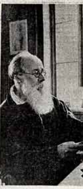
Народный художник СССР, действительный член Академии художеств СССР Владимир Андреевич Фаворский за работой в своей мастерской. (1952 год).