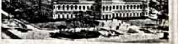
В Кашинском восстановлено здание бывшей гимназии, в которой учился славный сын молдавского народа, герой гражданской войны на Дальнем Востоке Сергей Лазо.

Когда возникла мысль о восстановлении этого, некогда красивого здания, выяснилось, что находится оно в крайне плохом состоянии. Минувшая война, землетрясения и подземные воды, которыми, испробуют местные грунты, взрывают подвала «здоровье» сооружения.