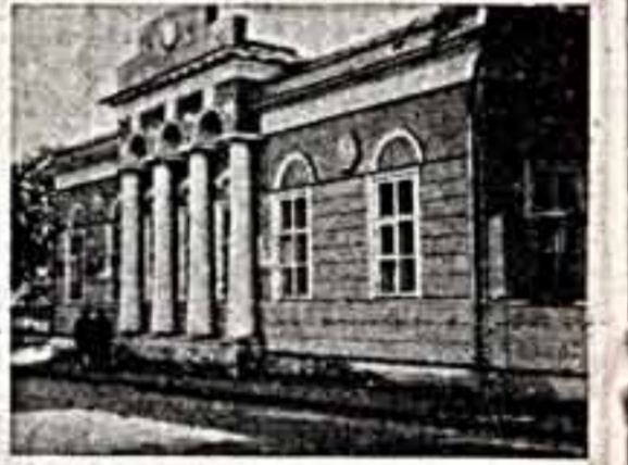
сохранения и обновления столицы нашей, сколько сберег от древности, преследуемый дерзостями, нашедшимися, обуглившимися злом людьми».

В самом деле, крохотный особняк поражает не только изящной простотой, но и достоинством. Его отличают безупречные архитектурные формы — четкий рисунок главного фасада, стройный декоративный портал, образующий четырем лепным колоннами, вырезанный по кружкам арки колонны, гирлянда вместо привычного герба. Кажется, нет таких архитектурных атрибутов типичного московского ампир, которые не присутствовали бы здесь. Не так лаконичны и чисты они, словно только намечены. Безусловно, это почерк большого мастера. Вряд ли управляющий канцелярией московского главнокомандующего, выпустивший законченный строительный план, принадлежит к построению своего дома второстепенного архитектора. А в том, что Штейнгель забрался в лице города, убеждают слова Эдгара Соколова: «Скромно сделано бароном Штейнгелем для