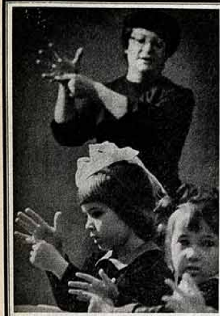
Музыкальный урок...

Реликвия семьи становится свидетельством истории. То, о чем рассказывает большинство современных писем, нельзя воспринимать и обдумывать на ходу.