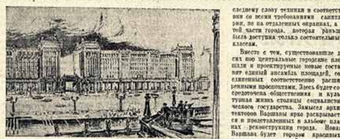
Такой будет Варшава в 1955 году. Просит новых зданий на углу Маршаловской и Хмельной улиц.

Более 60 лет прошло со дня первого выступления оркестра русских народных инструментов, организованного замечательным русским музыкантом В. В. Андреевым. Патристическое название талантливого музыкального деятеля пришло к себе самое прикладное значение передовой русской общественности. И. Н. Чайковский, Л. Н. Толстой, А. М. Горький, И. Е. Репин, В. В. Верещагин, А. Г. Рубинштейн и многие другие крупнейшие деятели русской культуры своими высказываниями, советами немало способствовали развитию творческой деятельности оркестра.