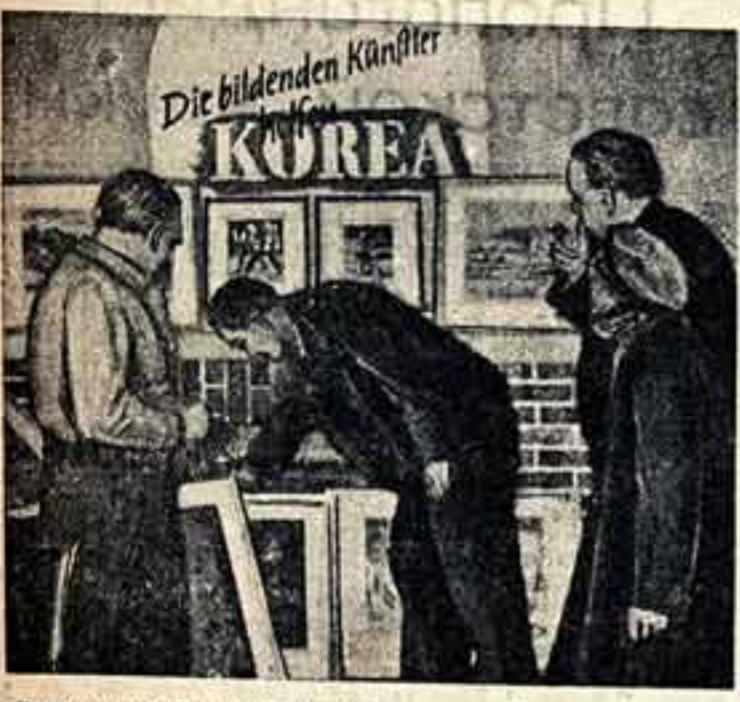
«Детали изобразительного искусства помогают Корею. Под таким лозунгом состоялся выставка работ немецких художников в Дрездене. Весь сбор от продажи произведений поступил в фонд помощи героическому корейскому народу, сражающемуся против американских захватчиков.