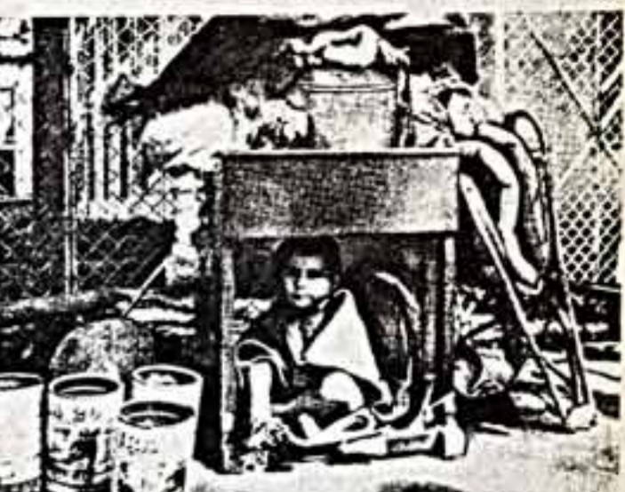
Гватемальская нищета... Так лаконично, двумя словами, прокомментировал мексиканский журнал «Панорама» сей крикострашный кадр бедственного положения бездомных людей в этой латиноамериканской стране.

В последние годы в Венгрии построено много новых гостиниц. И все же в отелях мест не хватает: на десять миллионов жителей страны ежегодно приходится до пятнадцати миллионов туристов. Однако выход был найден.