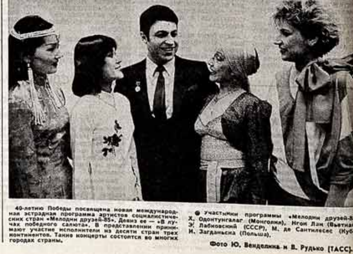
40-летие Победы посвящена новая международная эстрадная программа артистов социалистических стран «Мелодии дружбы-85». В программу включены участники из десяти стран трех городов страны.

«Сказка сказок» Ю. Норштейна — эта замечательная исповедь художника тонко воссоздает эмоциональную атмосферу целого периода в жизни нашего народа, в центре которого — война. Трилогия А. Хражановского по рисункам Пушкина: «Я и вам Леоу вспоминаем», «И с вами снова я», «Сенья» — это своеобразный гимн, философически достоверный образ поэта на фоне широкой панорамы его эпохи. «Большой Галль» Р. Рамаза воссоздает мир старинной легенды о добром великане, ставшем на защиту своего народа. «Ад» — последняя работа того же режиссера — передает ужасы бесчеловечности и вынужденного разбушевавшегося сил зла, не замечаящих приближения расплаты. Научно-фантастический фильм А. Петрова «Полночь» расширяет и углубляет идею сохранения мира. «Треугольник» П. Пярта в весьма ироничном изложении поднимает важную тему взаимоотношений мужчин и женщин. Фильм-памфлет Ф. Хитрука «Остров» повествует об одиночестве маленького человека в современном западном мире; притча «Инар и мудрец» того же автора представляет собой новое осмысление мифа об Икаре. Тамов далеко не полный обзор лучших работ, созданных в области взрослой мультипликации за последние годы. Эти фильмы награждались на фестивалях, о них писались рецензии, очерки, книги. Но они заслуживают большего — встречи с самым широким зрителем. Как было бы замечательно, если бы Центральное телевидение сделало своей многомиллионной взрослой аудитории расширенное подшошение — предоставило экран для демонстрации мультифильмов.