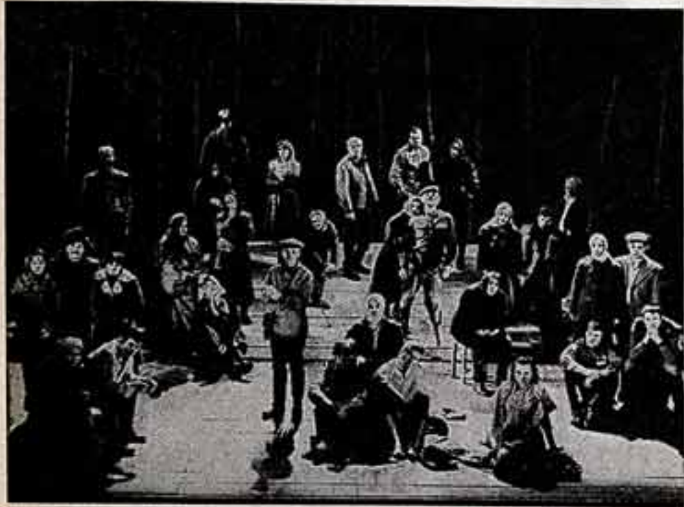
О судьбах народных, о высоте и стойкости человеческого духа повествуется в драматической диалогии «Братя и сестры» — новая работа на премьере которой пригласил зрителей Ленинградский Малый драматический театр. Полнометровый спектакль написан по подлинным документам эпохи лауреата Государственной премии СССР писателя Федора Абрамова о судьбе нескольких поколений семьи Присыпных.