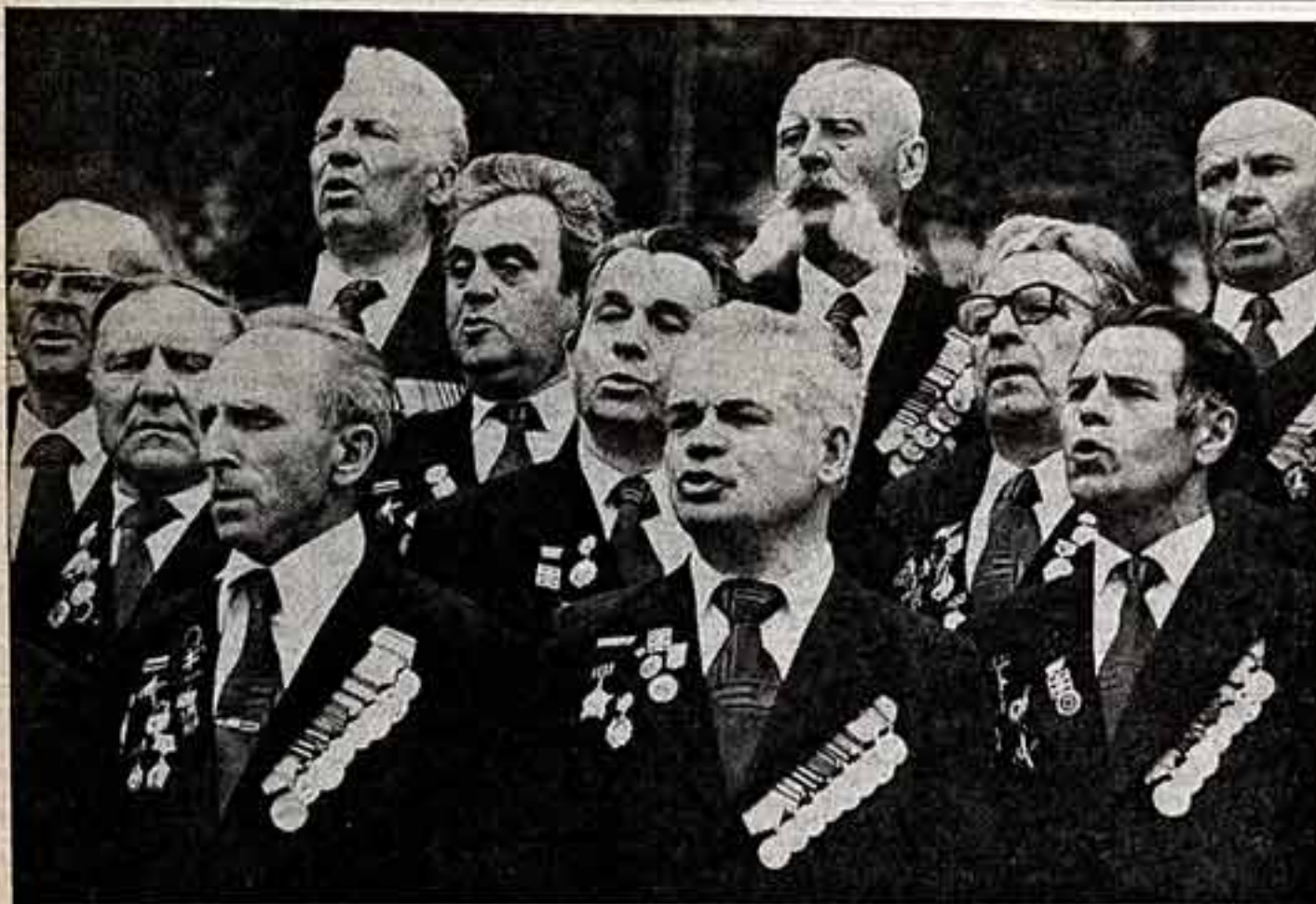
В. ДОЛМАТОВСКИЙ. «Этот день мы приближали, как могли...»