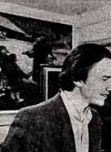
Цель конкурса — средствами изобразительного искусства раскрыть образ вождя революции и его соратников по борьбе в годы гражданской войны...

Более 100 живописных и графических работ поступило со всех концов страны на конкурс «В. И. Ленин и Ленинское наследие». Среди победителей 115-я годовщина со дня рождения Ильича.