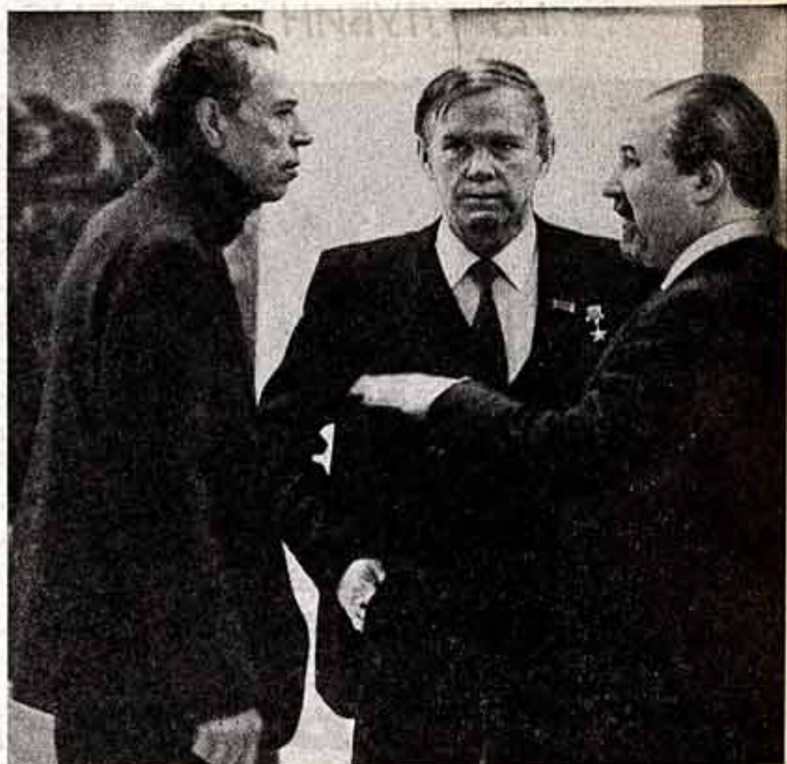
Все, что приезжает в город-герой Минск, неизменно стремится посетить белорусский государственный музей истории Великой Отечественной войны, где собраны многочисленные материалы, рассказывающие о зверствах гитлеровцев на белорусской земле...

В тот вечер царичанцы долго не отпускали известного гостя. Он поведал рассказы о патристике советских атлетов, выступавших на зарубежных стадионах, об олимпийском движении, которое сблизает народы мира.