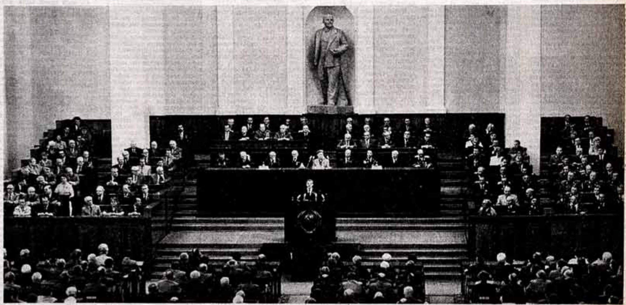
Москва, Кремль. 29 июля 1983 года. Торжественное заседание, посвященное 80-летию II съезда РСДРП.

Вместе с тем на заседании отмечалось, что в деятельности ряда партийных, советских, хозяйственных органов, трудовых коллективов, первичных партийных, профсоюзных и комсомольских организаций, еще не сделано должного поворота в борьбе за повышение эффективности производства и качества работы.