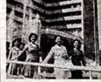
В праздничном наряде города и села народной Кореи...