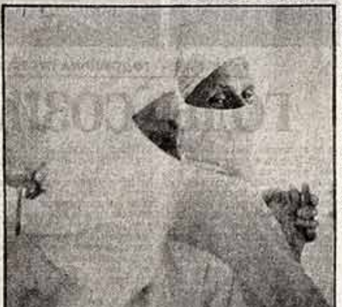
После операции. (Из серии «Хирурги».)