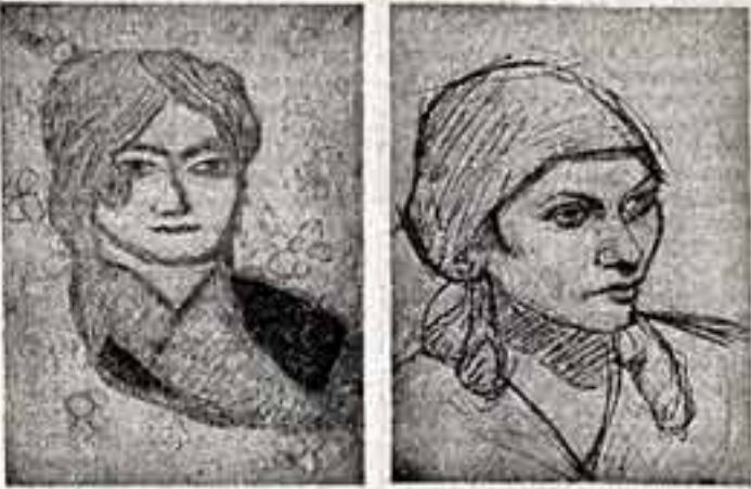
Рисунки Д. Бурлюка, В. Маяковского и В. Каменского.