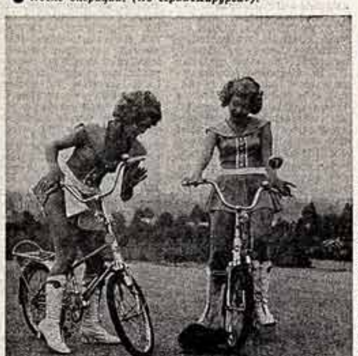
Новые велосипеды. (Из серии «Мой родной город».)