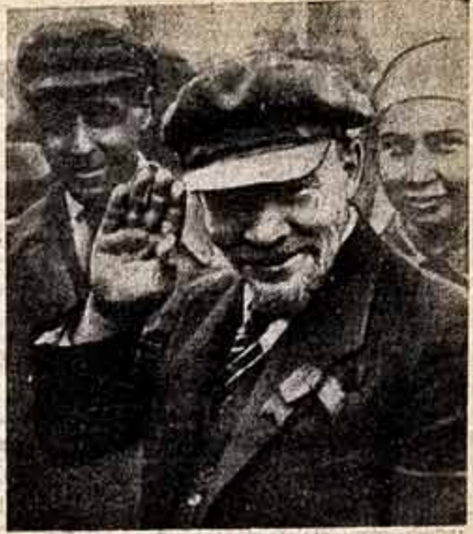
В. И. ЛЕНИН на закладке памятника Освобожденному труду 1 мая 1920 года.

В ЦЕНТРАЛЬНОМ ЗАЛЕ СТОЛИЦЫ ГОТОВИТСЯ НОВАЯ ЭКСПОЗИЦИЯ. НА ЭТОТ РАЗ ХОЗЯИНЫ МАНЕЖА БУДУТ ХУДОЖНИКИ ПОДМОСКОВЬЯ. ВЕРНИСЖАЖ ЧЕРЕЗ НЕСКОЛЬКО ДНЕЙ. «Подмосковье мое» — так будет называться выставка, которую представит областное отделение Союза художников Ю. Титов. Впервые произведения членов нашего отделения из 90 городов и поселков области будут представлены вместе в Москве, причем в самом ее представительном художественном салоне. Что мы покажем посетителям Манежа? Около 500 произведений живописи, 150 произведений скульптуры, 400 графических листов. Основными будут и более досконально искусство — более четырех тысяч произведений. В выставке примут участие около 600 художников.