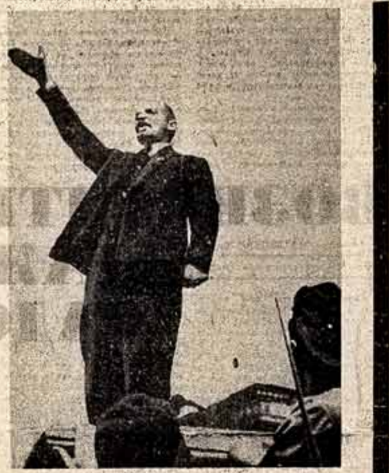
В. И. ЛЕНИН произносит речь на Красной площади на открытии памятника Степану Разину 1 мая 1919 года.

На долю павших в октябрьские дни прошлого года товарищей досталось великое счастье победы. Величайшая радость, о которой мечтали революционные вожди человечества, оказалась их достоянием; эта победа состояла в том, что по телам доблестно павших в бою товарищей прошли тысячи и миллионы новых борцов, столь же бесстрашных, обеспечивших этим героизмом массы победу. Товарищи! Почти же память октябрьских борцов тем, что перед их памятником дадим себе клятву идти по их следам, подражать их бесстрашию, их героизму.