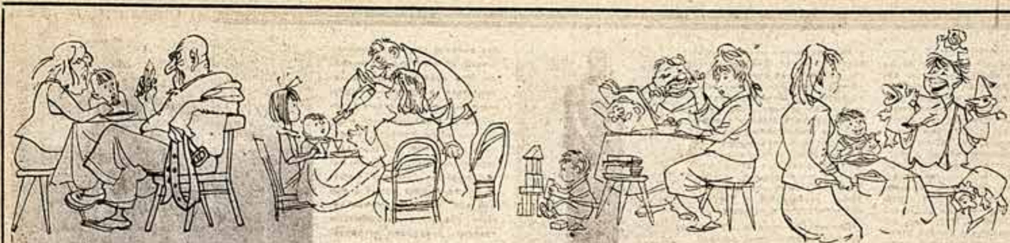
У меня разговор короткими сессиями — ничего, по маленькой монно, для аппетита. — Говорит тетя: проголодается — сам — Не знаю, чем ты голодаешь? У меня он кушает все.

С ЧЕГО НАЧИНАЕТСЯ ВОСПИТАНИЕ? НОВАЯ РУБРИКА «СК» «УНИВЕРСИТЕТ ДЛЯ РОДИТЕЛЕЙ» ДАСТ ВЕРОЯТНО, НЕМАЛО ПОЛЕЗНЫХ СОВЕТОВ ЧИТАТЕЛЯМ. СКОРМУЮ ЛЕПТУ В ДЕЛО ВОСПИТАНИЯ ХОТЕЛОСЬ ВНЕСТИ И МНЕ. НАПРИМЕР... КАК КОРМИТЬ РЕБЕНКА?