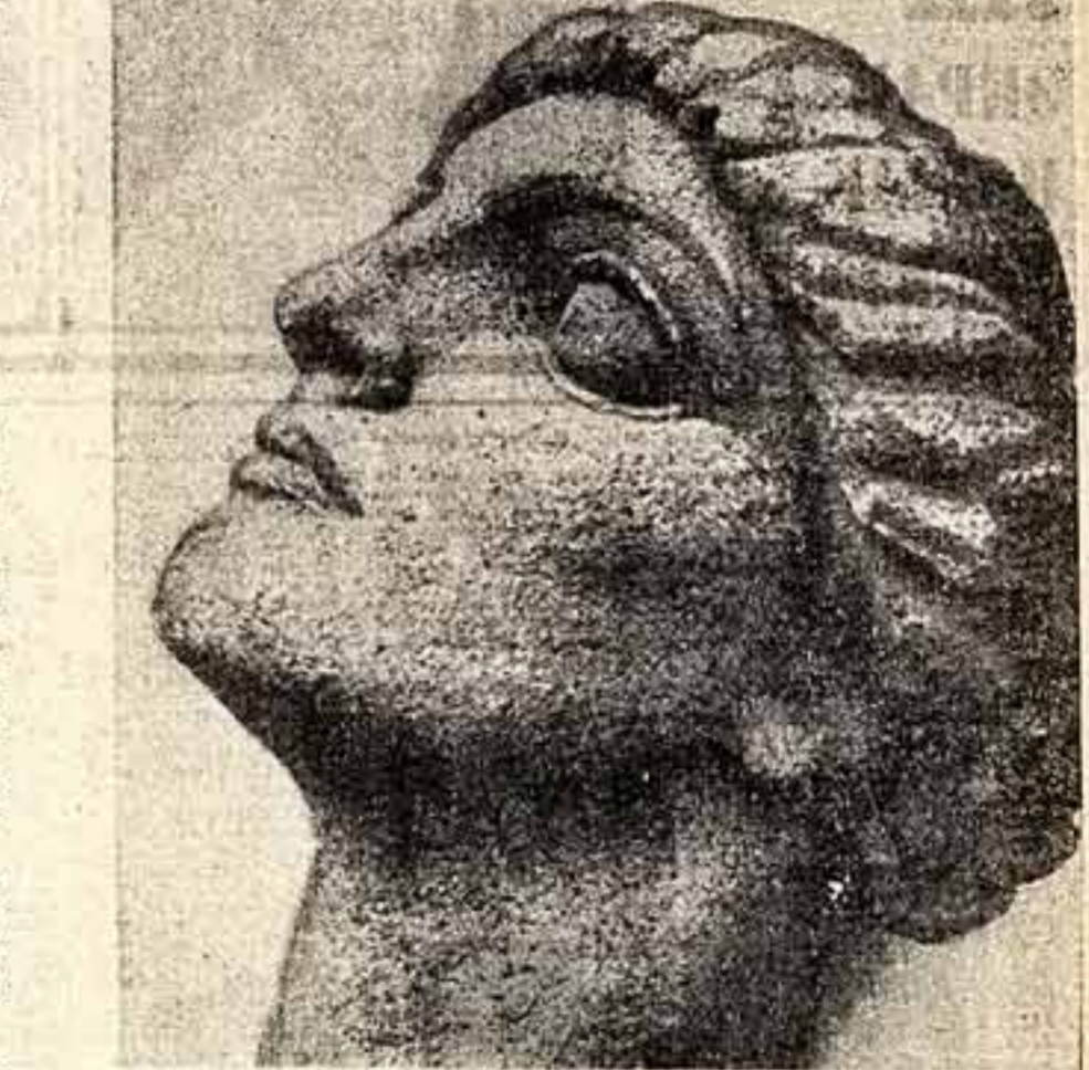
«ГЕНЬЯ СВОБОДЫ» из обелиска Советской Конституции, сооруженного скульптором И. Андреевым и архитектором Д. Осиповым. Ленин лично утвердил проект этого монумента. Памятник был открыт в дни первой годовщины Октября на Советской площади в Москве. Нельзя еще раз не высказать сожаления, что Москва лишилась этого памятника, замечательного дух времени.