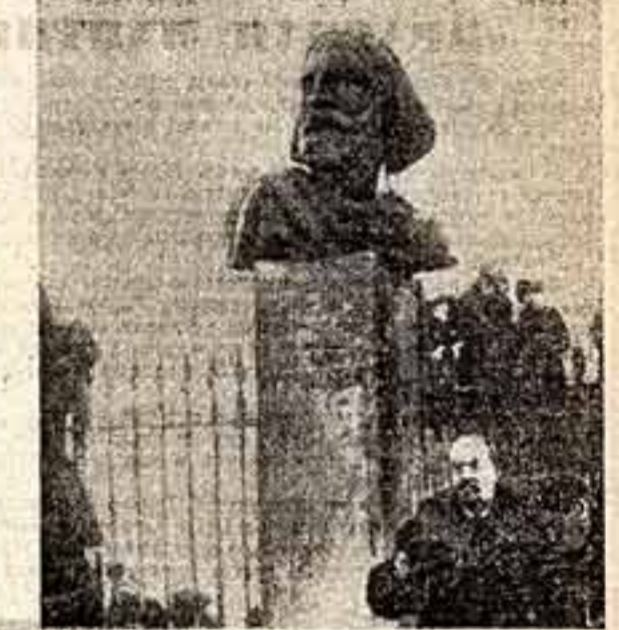
ПАМЯТНИК ГАРИБАЛЬДИ, созданный молодым латышским скульптором И. Зле. Был поставлен в Петрограде в 1919 г. На склоне лет, убитый А. В. Луначарского, выступавшего на торжественной открытии памятника.