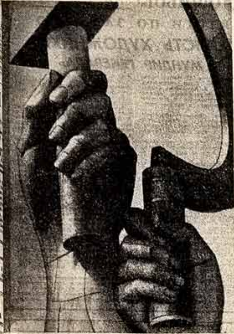
Мощные руки, поднявшие «высь Серп и Молот» — «РАБОЧИЙ И КОЛХОЗНИЦА» Веры Мухомовой. Стальные гиганты с землей труда Советской державы. Это великое творение искусства — высшее выражение идеи «монументальной пропаганды», осуществляемой по заветам Ленина на протяжении всего полувеков советской истории.

МОНУМЕНТАЛЬНАЯ пропаганда — эти два слова обозначают целый лабиринт в развитии нашего искусства и целую эстетическую программу. Говоря о монументальной пропаганде сегодня в связи с 50-летием ленинского плана, мы, естественно, возвращаемся мысленно к истокам советской художественной культуры. Нам притягивает своеобразное искусство, которое утверждало себя в первые месяцы и годы после победы Октября. Искусство, которое положило начало всему дальнейшему развитию творчества советских художников и вместе с тем сохранило неповторимые черты революционного времени.