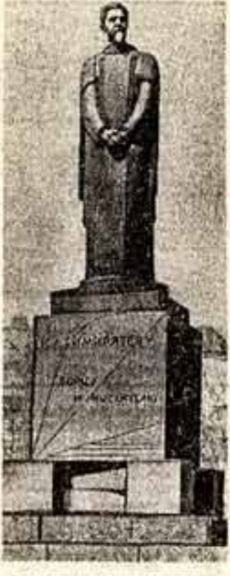
ПАМЯТНИК ТИМИРЯЗЕВУ у Никитских ворот в Москве. Скульптор С. Мернуров, архитектор Д. Осипов. Поставлен в первые послеоктябрьские годы. Выразительность памятника во многом связана с выразительностью материала — гранита, мастерски использованного в самом изваянии и в постаменте.

Новые памятники появились также в Киеве, Минске, Витебске, Омске, Одессе и т. д. История скульптуры не знает другого примера, когда бы за столь короткий срок было поставлено так много памятников. Темп творческой работы был необычайно быстрым, почти стремительным, каким он мог быть в годы революционной активности масс.