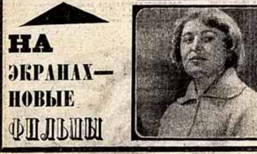
НА ЭКРАНАХ — НОВЫЕ ФИЛЬМЫ

объявляет конкурс на замещение должности концертмейстера симфонического оркестра.