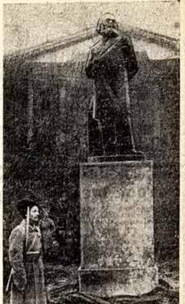
ПАМЯТНИК МАРКСУ, поставленный скульптором А. Матвеевым в дни празднования годовщины Октября перед зданием Смольного. Это был первый монумент в честь великого революционер-мыслителя. Выполненный из гипса, памятник не сохранился и впоследствии был заменен другим.

Ленин придавал большое значение этим церемониям. Об этом свидетельствуют его речи на торжествах открытия или закладки памятников. Он говорил, что каждый открытие надо превращать в акт пропаганды идей революции. Он призвал руководящих деятелей партии выступать на этих торжествах. Около поставленных памятников собирались митинги, проходили демонстрации. Газеты называли их кулуарными кафедрами.