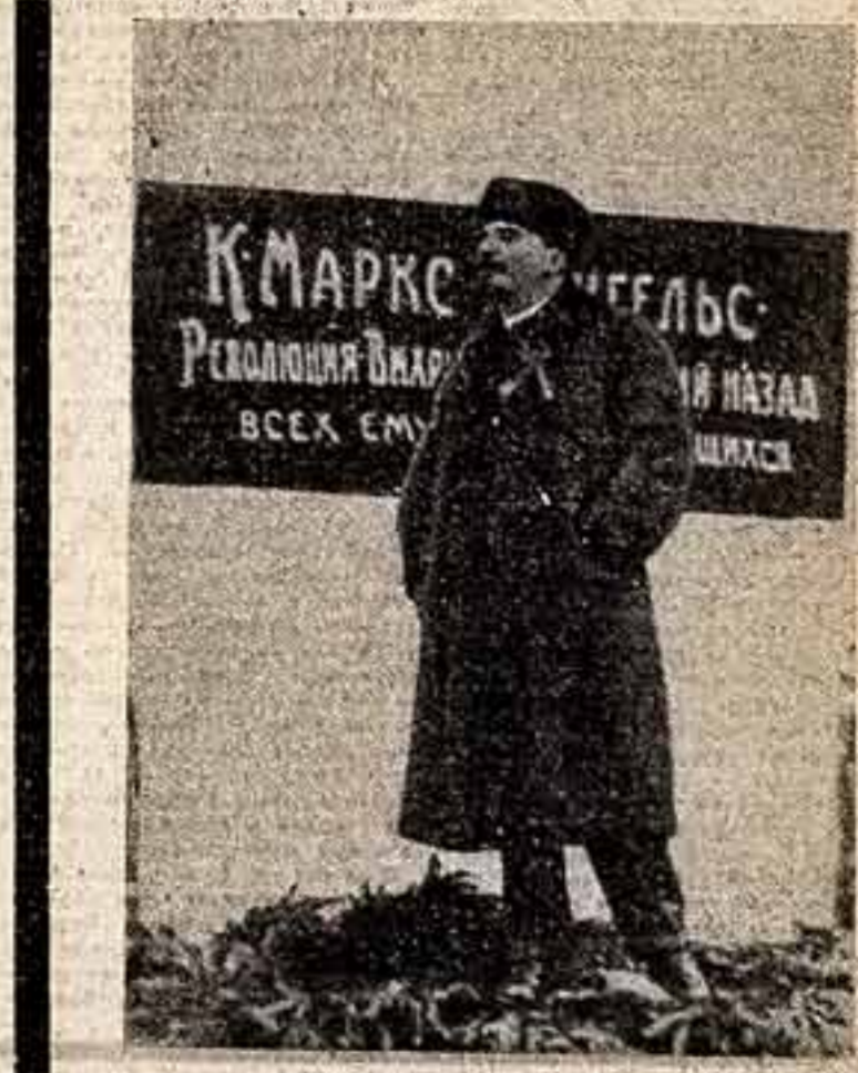
В. И. ЛЕНИН выступает на открытии памятника Марксу и Энгельсу 7 ноября 1918 года.

Великая всемирно-историческая заслуга Маркса и Энгельса состоит в том, что они указали пролетариату всех стран их роль, их задачу, их призвание: подняться первыми на революционную борьбу против капитала, объединить вокруг себя и этой борьбе всех трудящихся и эксплуатируемых. Мы переживаем, следовательно, время, когда это призвание великих социалистов стало обязательным. Мы видим все, как в целом ряде стран занимается зари международной социалистической революции пролетариата. Пусть же памятники Марксу и Энгельсу еще и еще раз напоминают миллионам рабочих и крестьян, что мы не одиноки в своей борьбе. Рядом с нами поднимаются рабочие более передовых стран. Их и ждут еще тяжелые битвы. В нашей борьбе будет сломан гнет капитала; будет окончательно разбит социализм!