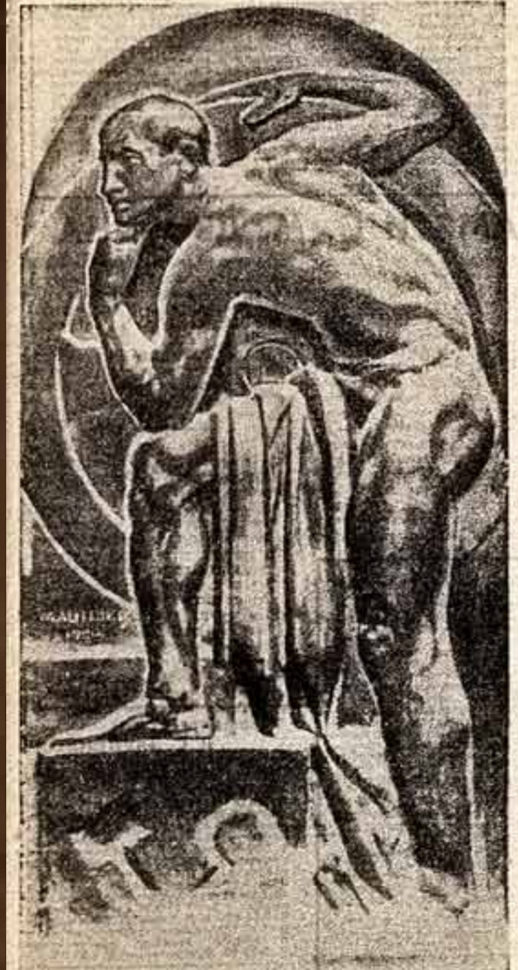
«РАБОЧИЙ» — рельеф М. Маизера, установленный в 1920 г. на стене Петропавловского пассажа в Москве. Фигура рабочего олицетворяет силу труда и одновременно представляет своего рода историческую аллегорическую фигуру: рабочий, вращая маховое колесо, «слово» приводит в движение колесо истории.