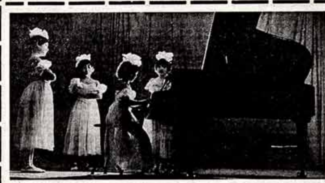
Своей 55-летней юбилей отметила Ташкентская республиканская музыкальная школа искусств...