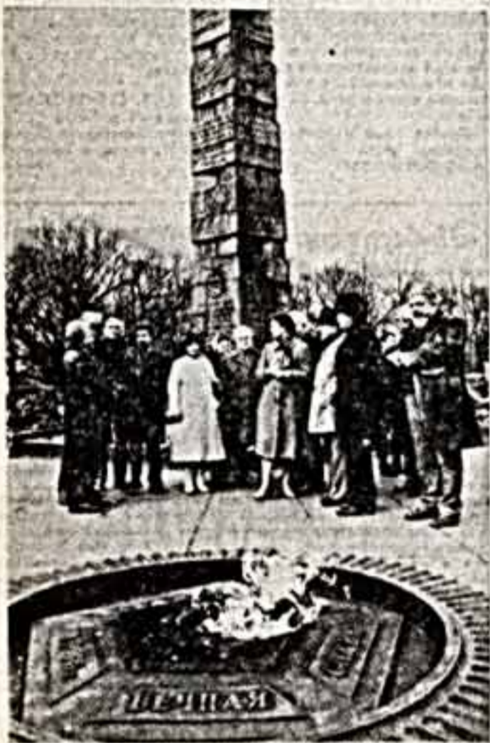
Для советской литературы поставлено в Калининграде. Группа писателей — гостей на республиканском конкурсе, в числе их Игорь Киселев.