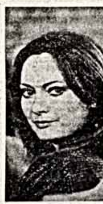
Говорит — художником надо родиться. Настоящим художником, разумеется. Но что талант без силы духа, упорства, трудолюбия, твердого гражданского позиционирования...