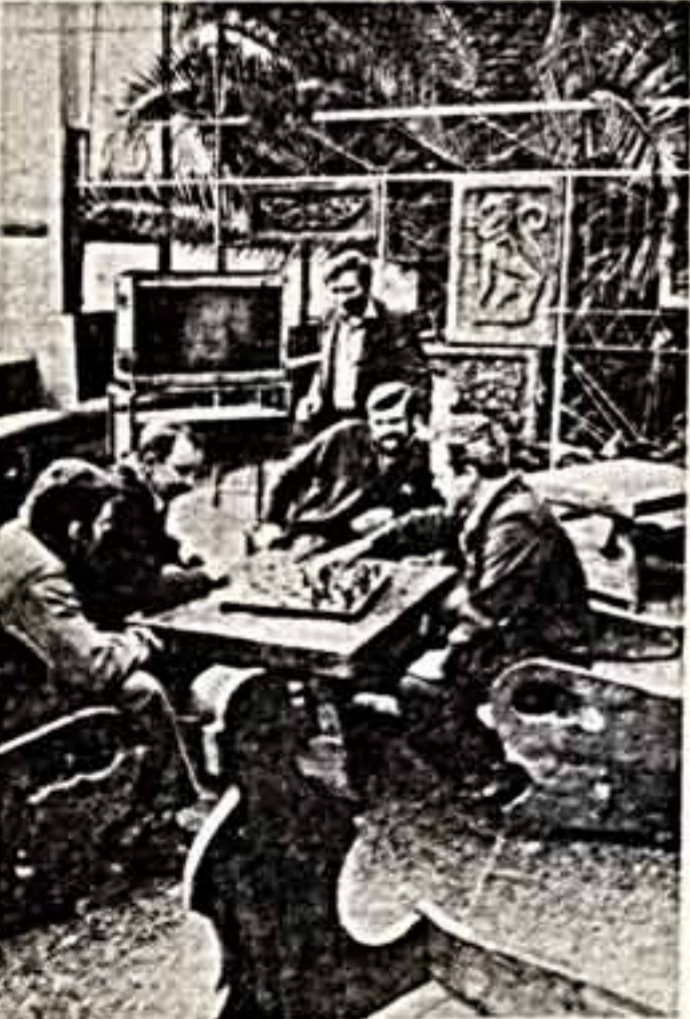
Для рабочих Киевского завода тракторных деталей частей оборудования прекращен выпуск, где и свободное время можно хорошо отдохнуть, поехать и покататься.