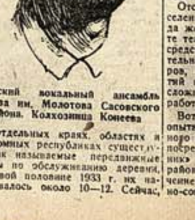
Татарский вокальный ансамбль колхоза им. Молотова Савосского района. Колхозница Конеева.

Музыкальная часть спектакля — это не просто музыка, это искусство. Такой оркестр в колхозных театрах создается впервые; помимо музыкального сопровождения спектакля — оркестр будет вести самостоятельную работу по приобщению широких колхозных масс к музыкальной культуре.