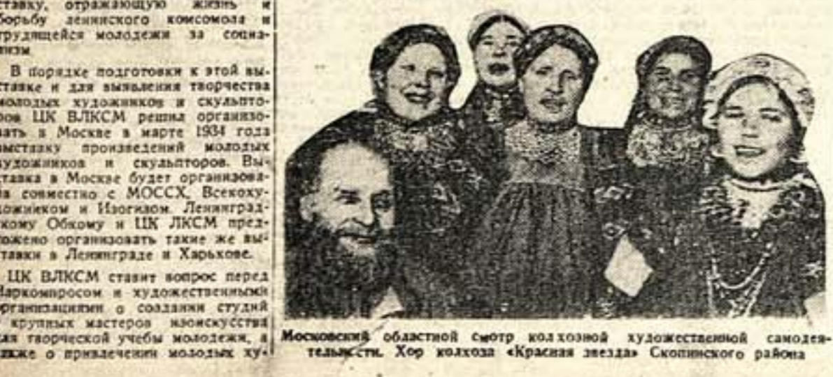
Московский областной смотр колхозной художественной самостоятельности. Хор колхоза «Красная звезда» Скопинского района

В 1933/34 году проводится всесоюзная олимпиада детской художественной самостоятельности. Это массовое мероприятие должно объединить внимание партийных, профессиональных, педагогических, советских и общественных организаций к вопросам художественно-творческой и исполнительской работы ребят, к художественному воспитанию их в школах и школьных учреждениях, к вопросу профессионального искусства для детей.