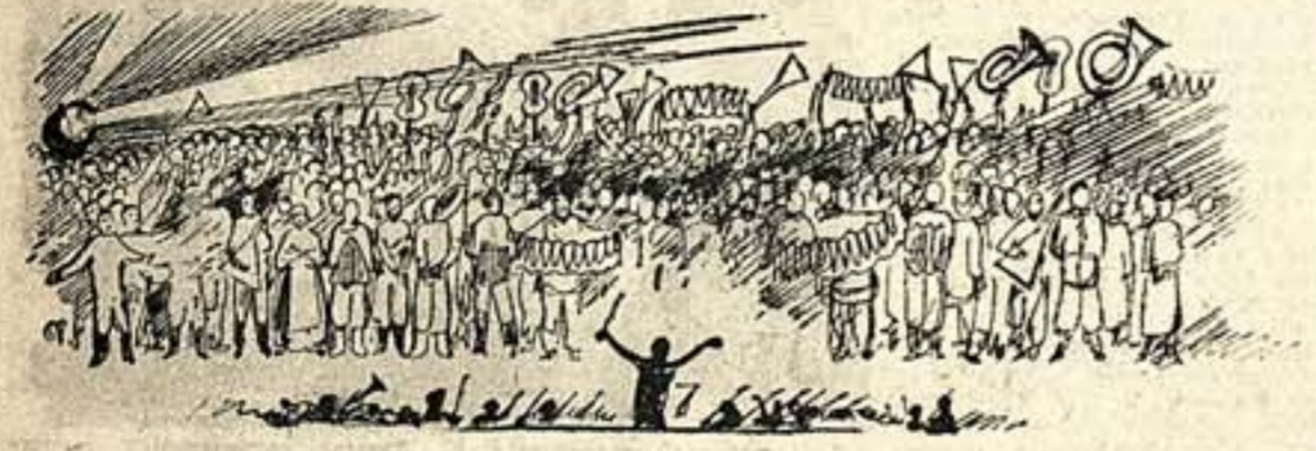
Парад участников смотра колхозной самодеятельности искусства.

Блестящие успехи Советской страны во всех областях строительства создали базу не только для роста благосостояния, но и для социального расцвета культуры. Сила социалистической деревни, огромная волна художественной самодеятельности является наиболее показательной для нынешнего состояния культурной жизни деревни.