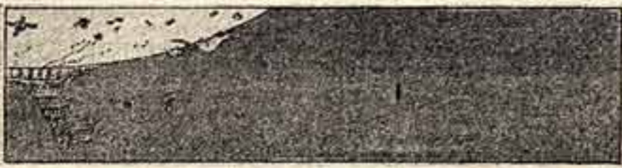
Два полюса мира. Рисунки художников Фад Чанг, Чжун Линя и Чанг Шань-ля.