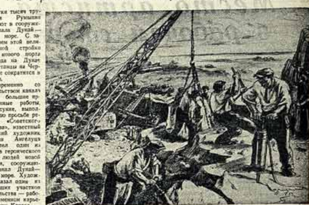
Десятки тысяч трудящихся участвуют в сооружении канала Дунай—Черное море. С завершенем этой величайшей стройки путь от нового порта Черновода на Дунае до Констанцы на Черном море сократится в пять раз.

Выставка советского изобразительного искусства, организованная в Будапеште осенью 1949 года, сыграла огромную роль в становлении нашей живописи, скульптуры, графики. Эта выставка показала венгерскому народу, что такое искусство, принадлежащее народу.