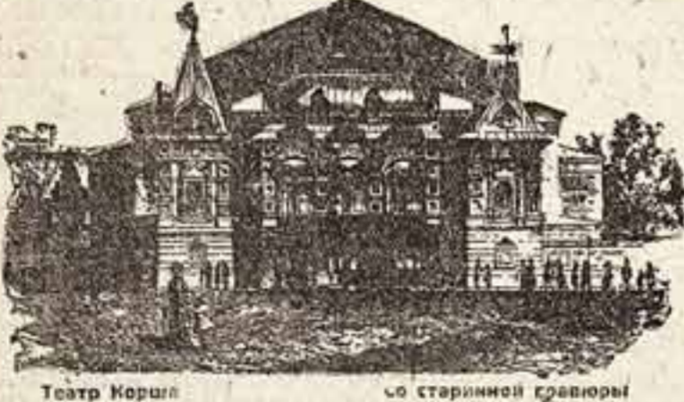
Театр Корша со старинной гравюры