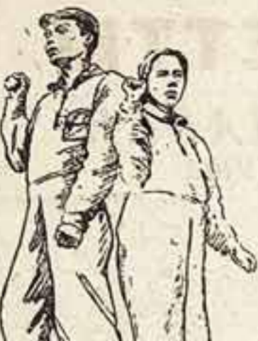
Историческая агитбригада (Томск)

Историческая рабочая театральная группа Московской области состоялась в момент встречи представителей культуры и искусства в социалистическом лагере. Историческая рабочая театральная группа Московской области состоялась в момент встречи представителей культуры и искусства в социалистическом лагере.