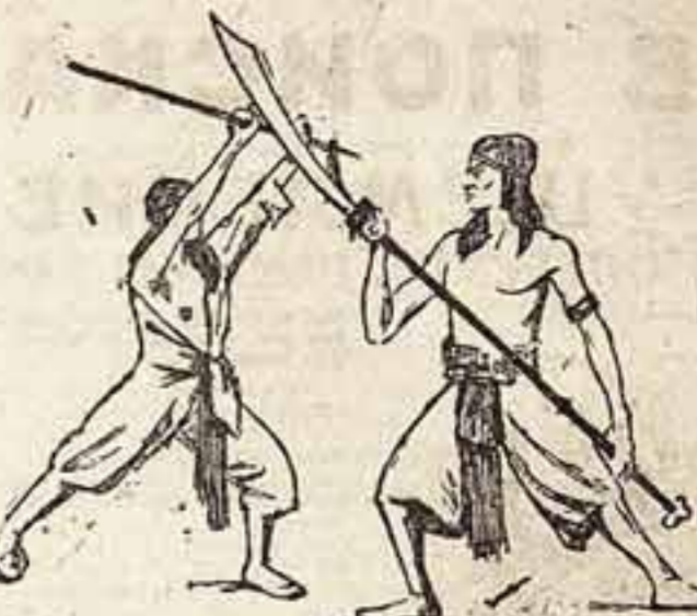
Китайский трам - Акробатический боб