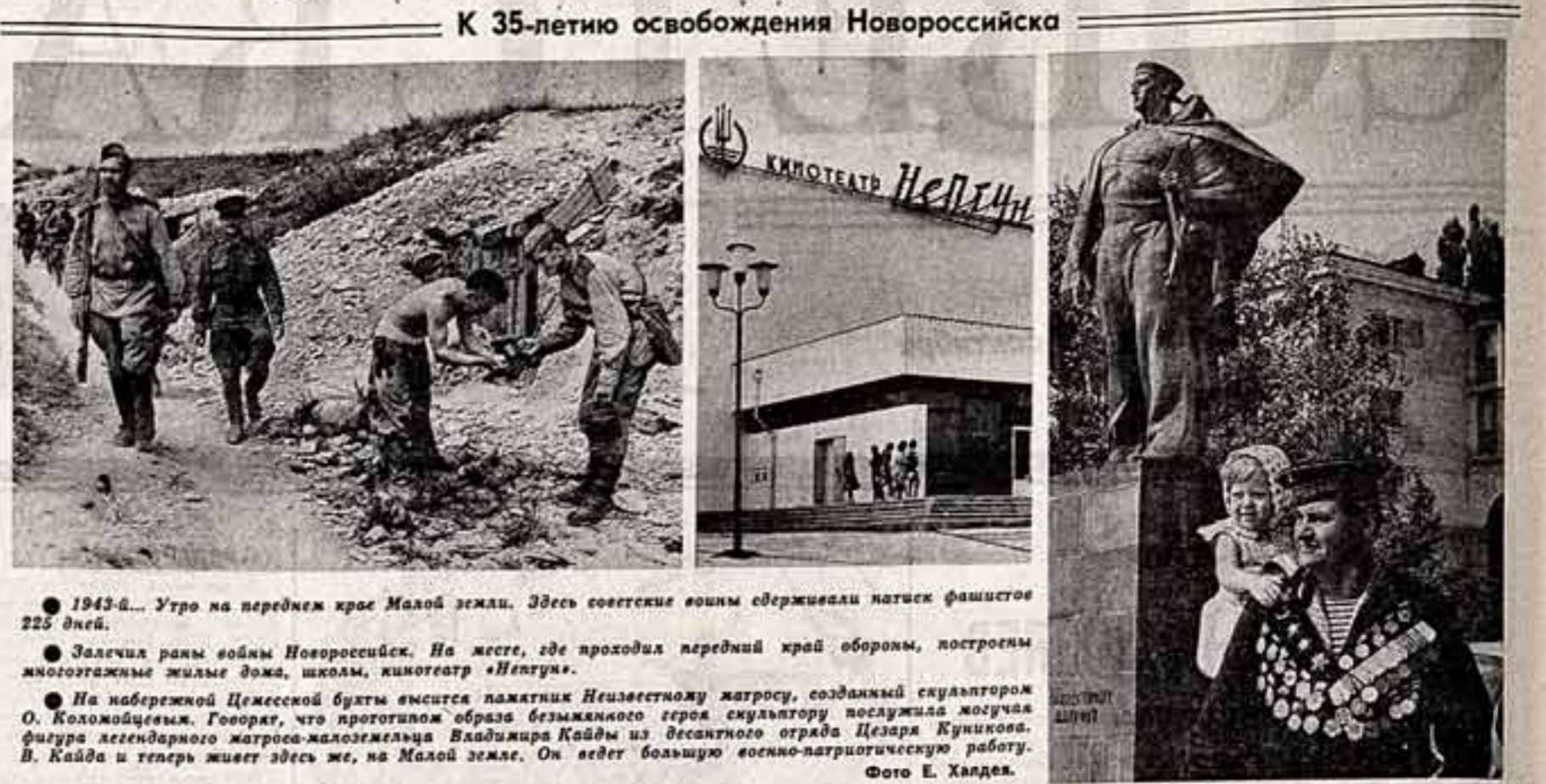
1943-й. Утро на переднем крае Малой земли. Здесь советские воины сдерживали натиск фашистов 225 дней.