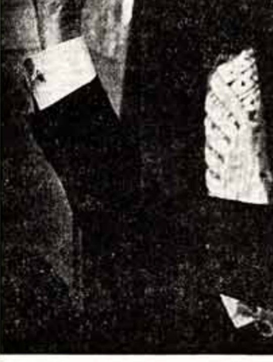
Н. СМОЛОВ. «Давите споме все вместе».

Этим переживаю во многом и объясняется известная растерянность критики 70-х годов. С одной стороны, высказались, что анализировать музыкальные фильмы с точки зрения высокого искусства бессмысленно.