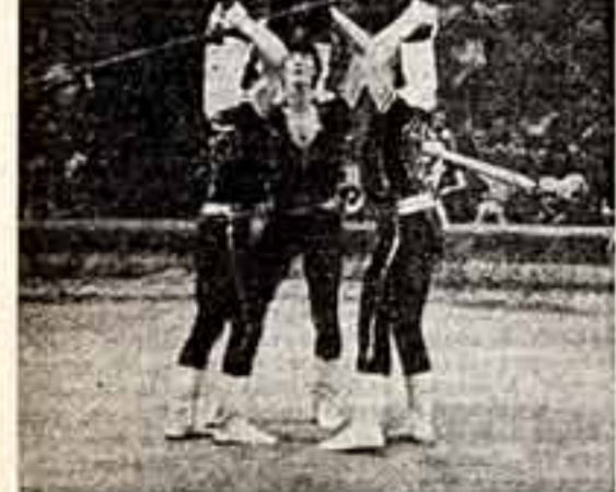
Международные маршруты По-южному тепло