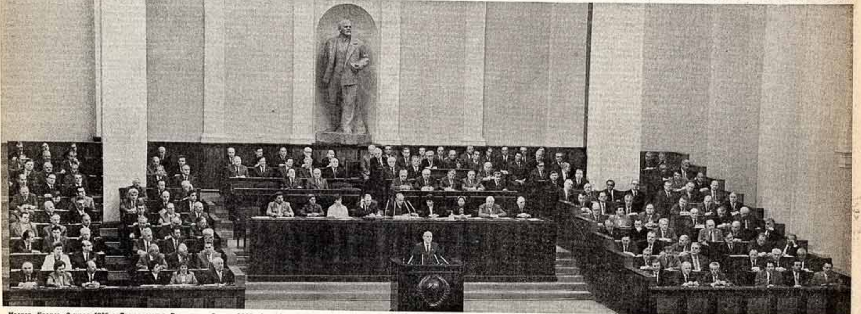
Москва, Кремль, 2 июля 1985 г. Третья сессия Верховного Совета СССР одиннадцатого созыва. Совместное заседание Совета Союза и Совета Национальностей.

ТРЕТЬЯ СЕССИЯ ВЕРХОВНОГО СОВЕТА СССР ОДИННАДЦАТОГО СОЗЫВА