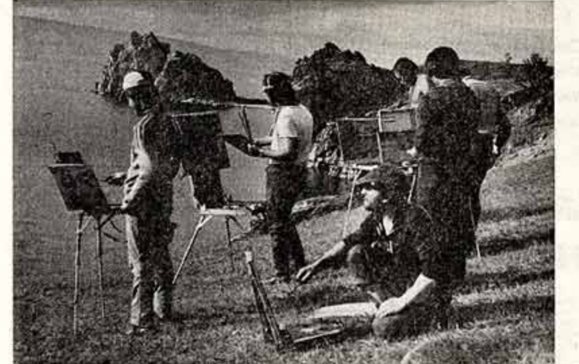
Сибирь и сибиряки, красота и характеры — благодатная тема для художника. ● Параллель (Тюмень). ● На трассе газопровода. ● Байкал — герой полета будущих художников, студентов Иркутского училища искусств.