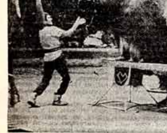
Большую и разнообразную программу подготавливают артисты цирка под руководством народного артиста СССР В. Оска-Оса...