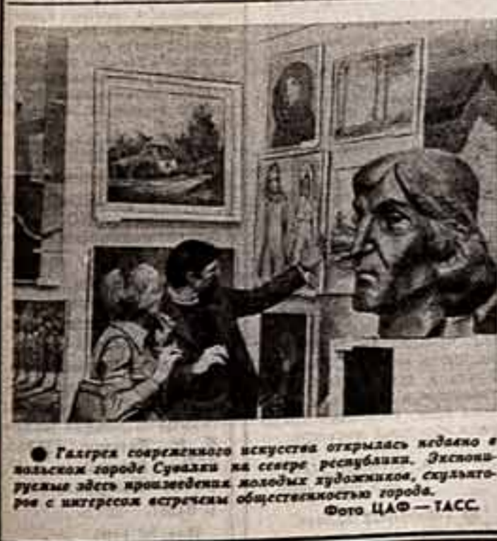
Галерея современного искусства открылась недавно в югославском городе Суваца на севере республики. Экспозиция здесь представляет молодых художников, скульпторов с интересом встречаясь общественности города.