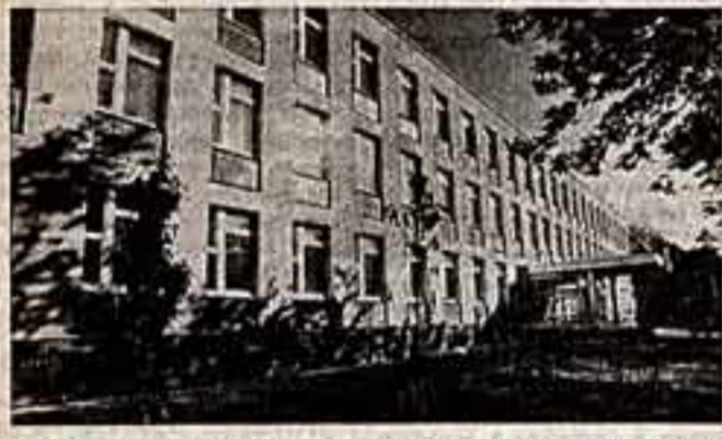
Новый Дворец пионеров Свердловского района города Москвы.