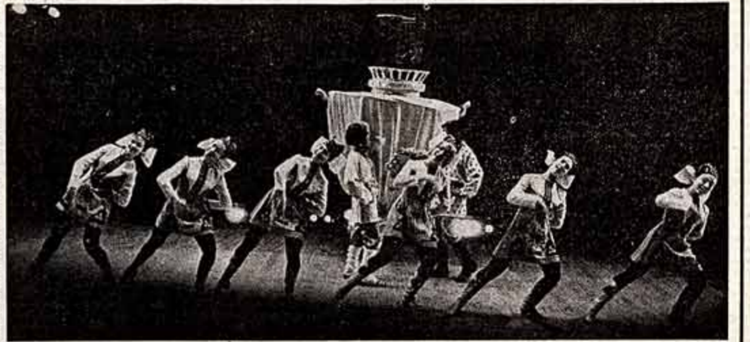
Танец «Балалайки» в исполнении ансамбля народного танца «Русские сувениры» Дворца культуры барнаульского производственного объединения «Химволокно».

Мургаб — один из районов Восточного Памира. А если точнее — его центр. Здесь на высоте свыше 4 тысяч 200 метров над уровнем моря человека, впервые полшагнув сюда, угрожают все опасности высокогорья. Даже люди, живущие в центре Горно-Бадахшанской автономной области — Хорго, отправляясь сюда, готовятся загодя, хотя и сами живут на высоте почти трех тысяч метров.