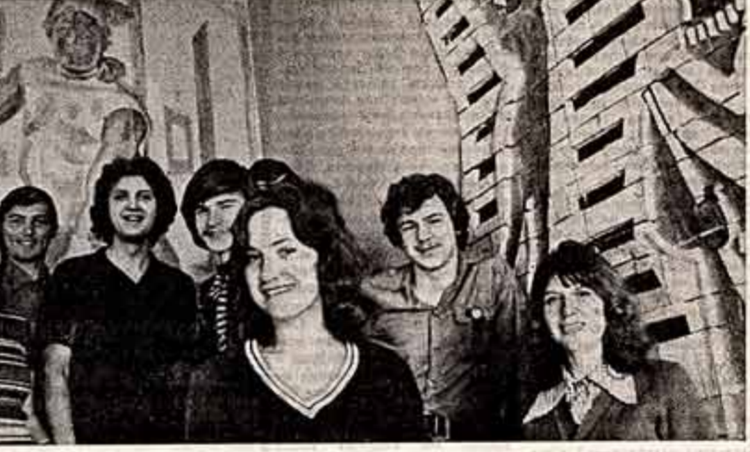
Завтра у студентов Московского высшего художественно-промышленного училища переки лекция.

● Артисты ансамбля народного танца с этого года начнут готовить Красноярское училище искусства.