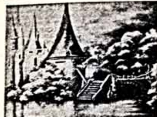
У каждой даме самой маленькой сказки есть свой голос: надо ведь кому-то прошептать: «Жиза да быль», чтобы стало понятно, что сказка началась. А наше сказка совершенно необычная, потому что голос ее можно не только услышать, но и увидеть. Смотрите: вот голос нашей сказки — ушастый.