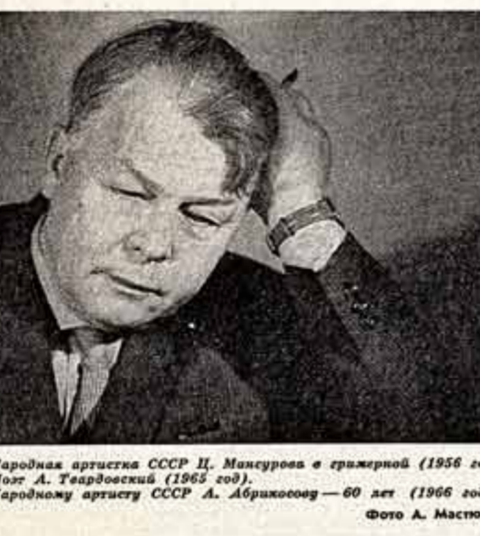
Народная артистка СССР Ц. Мансурова в эстрадной (1956 год). Народная артистка СССР А. Тейрбоскес (1966 год). Народному артисту СССР А. Абрахамову — 60 лет (1966 год).