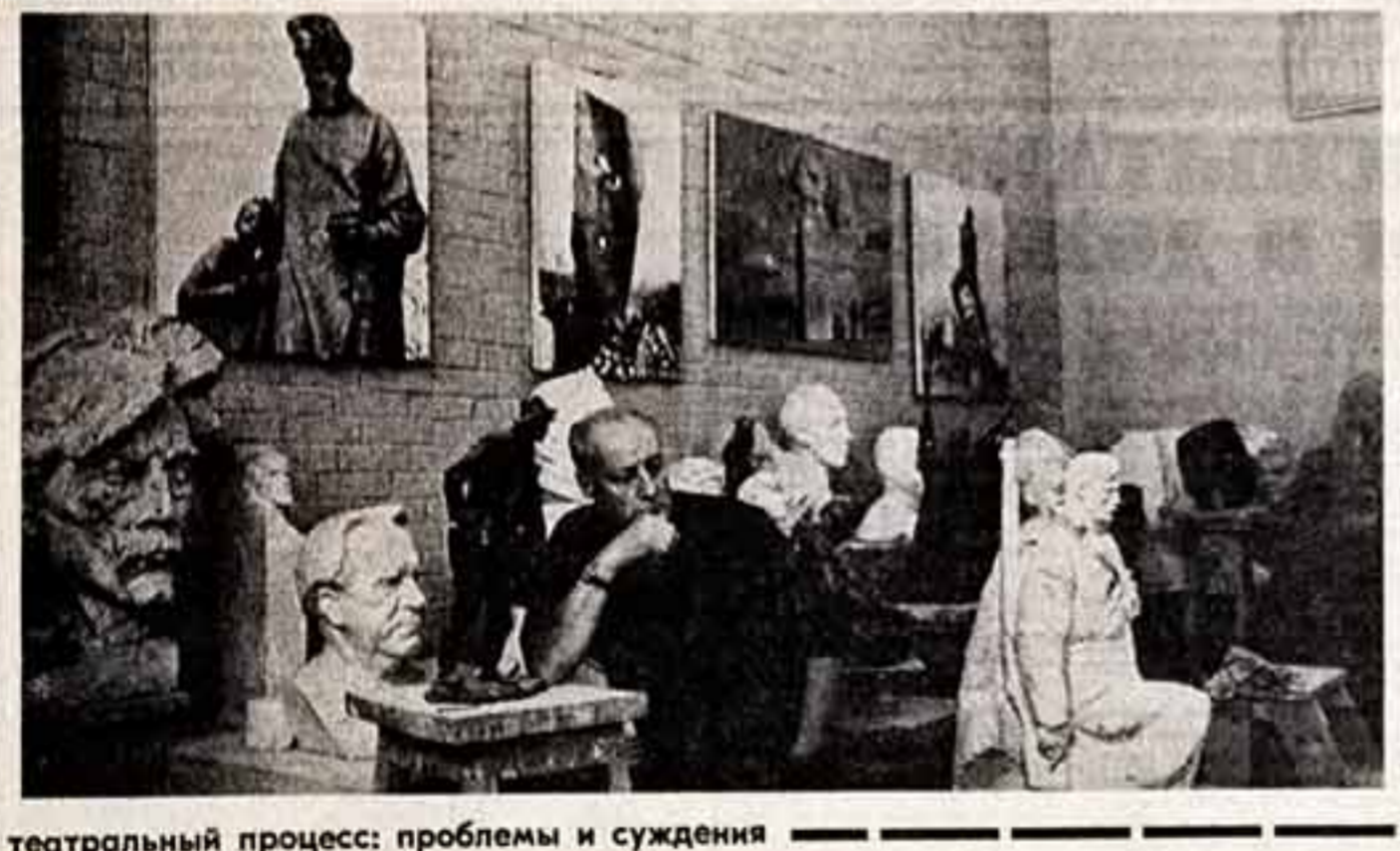
театральный процесс: проблемы и суждения

Александр Михайлович Файко был одним из значительных советских революционных драматургов.