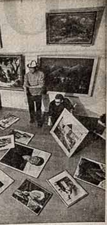
Киргизская ССР. Музей изобразительных искусств колхоза «Красная зора» Ленинпольского района стал для сельских труженников Таласской долины центром пропаганды прекрасного...

Н. Е. ГОРОВА, иш. соб. корр. А. ЧЕША, РОСТОВ-НА-ДОНУ — ХАРЬКОВ.