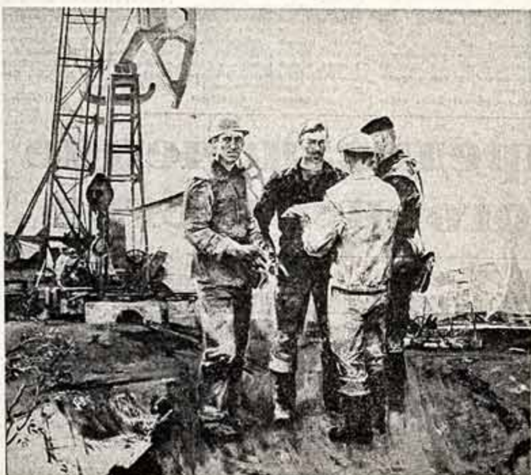
РИТМ УДАРНОГО ТРУДА

Советский рабочий класс, колхозное крестьянство, наша народная интеллигенция, беззаветно преданные делу ленинской партии, будут и впредь повышать свою организованность, сплоченность, трудовую активность, чтобы еще могущественнее была наша великая Советская Родина — оплот мира во всем мире.