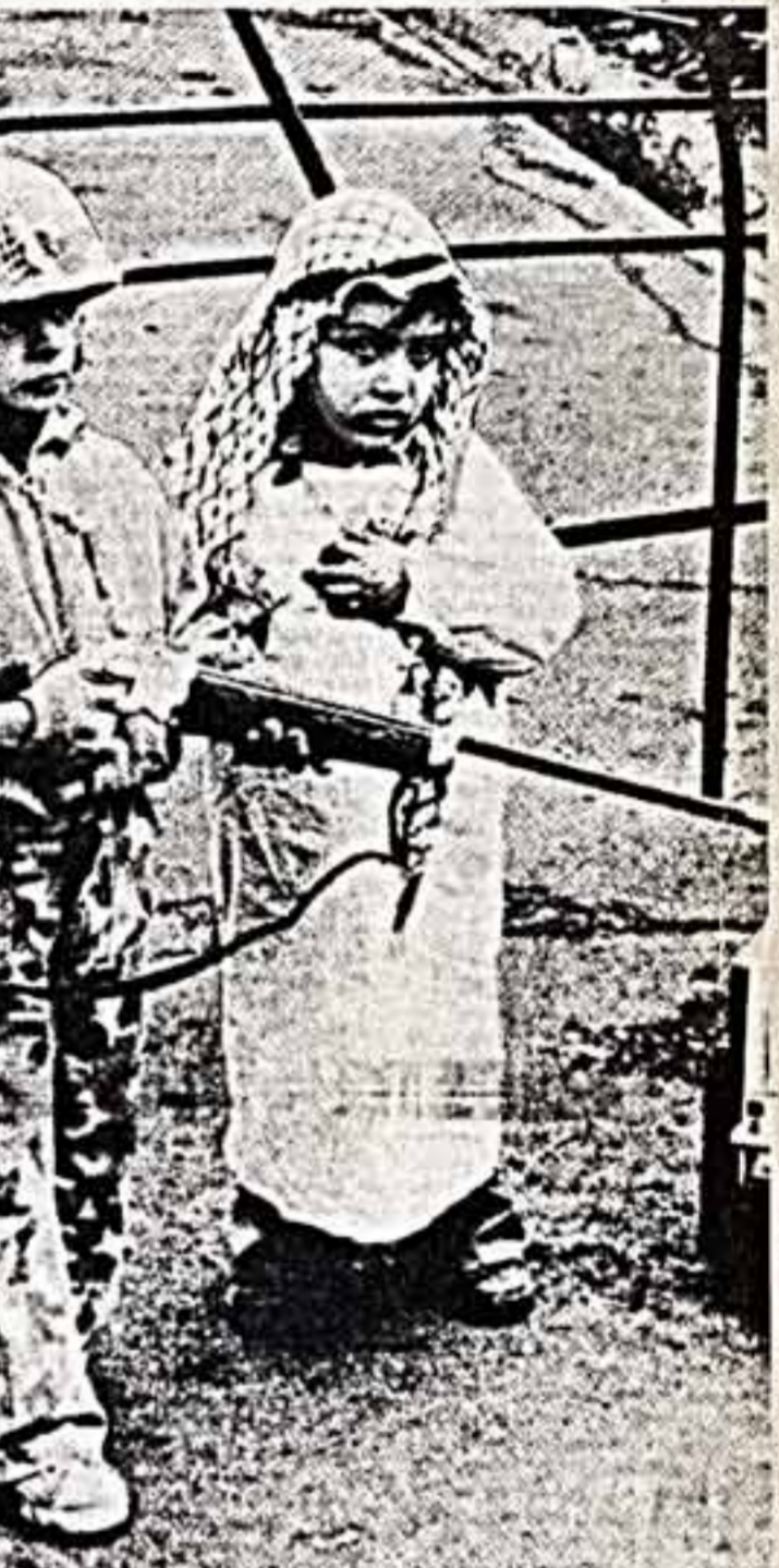
Фото из журнала «Камбио-16» (Испания).