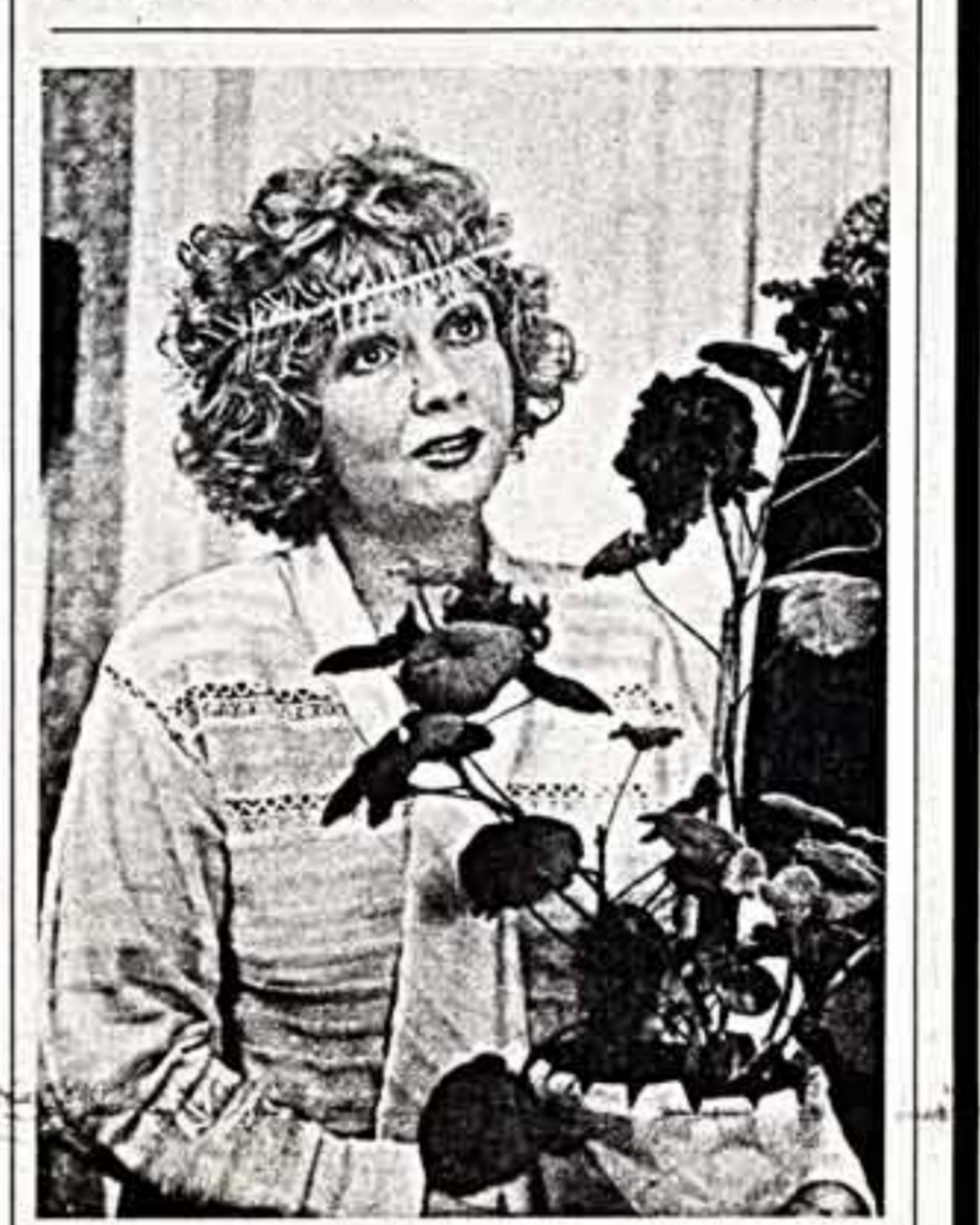
Наталья Гундарева и Валентин Гафт снимаются в главных ролях в новой юбилейной картине «Не простишь и мужикам»...