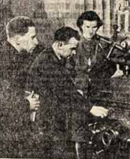
Работники Московского станкостроительного завода «Красный пролетарий» — учащиеся вечернего машиностроительного института на занятиях в лаборатории по курсу металлорежущих станков.