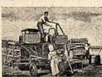
На снимке: новая машина для посадки картофеля. За смену она высаживает квадратным способом около 41 тысячи торфоперегнойных горшочков с клубнистой рассадой на площади в два гектара.

Десятый номер киножурнала «Новости сельского хозяйства» целиком посвящен пропаганде передового опыта колхозов и совхозов Московской области, в которых широко применяется квадратно-гнездовой способ посадки и сева картофеля и овощей. Этот способ намного сокращает затраты труда на посадках и уходе за растениями, повышает их урожайность.