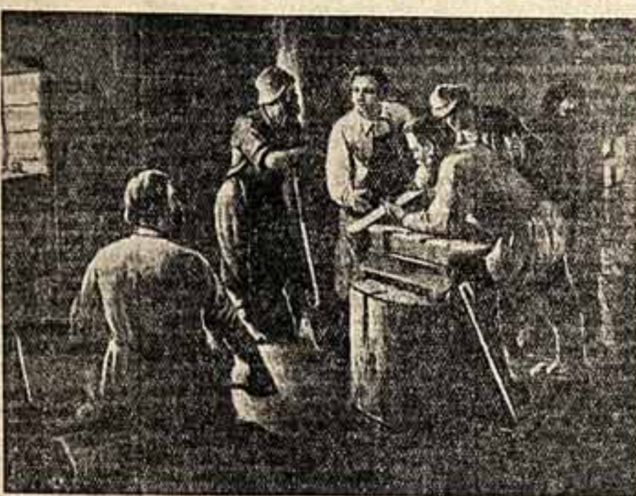
Картина художника В. Мещерякова «Рождение булгата».

В течение двух месяцев в залах Челябинской картинной галереи была открыта выставка работ художников области. Местные художники представили на выставку около ста изданных произведений живописи, графики и скульптуры, созданных за последние два года.