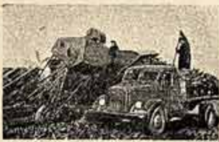
На снимке: комбайн «КУ-2» выгружает собранные и очищенные початки кукурузы в автомашину.