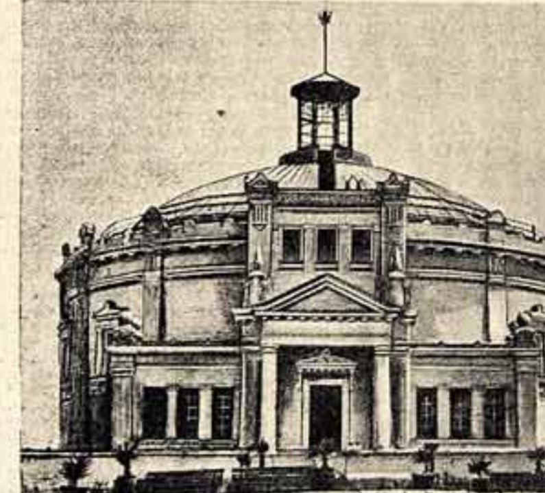
Здание панорамы «Оборона Севастополя».