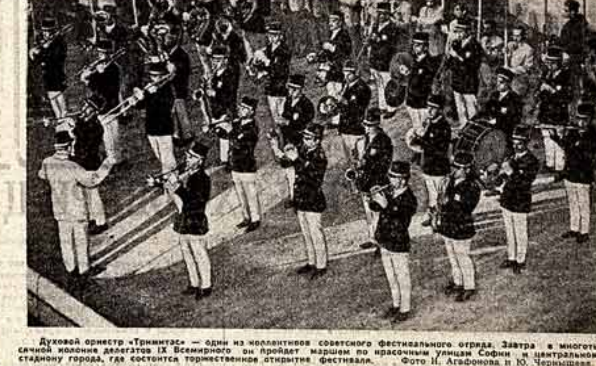
Духовой оркестр «Тригитас» — один из коллективов советского фестивального отряда. Завтра в многотысячной колонне делегатов IX Всемирного он пройдет маршем по красочным улицам Софии и центральному стадиону города, где состоится торжественное открытие фестиваля.