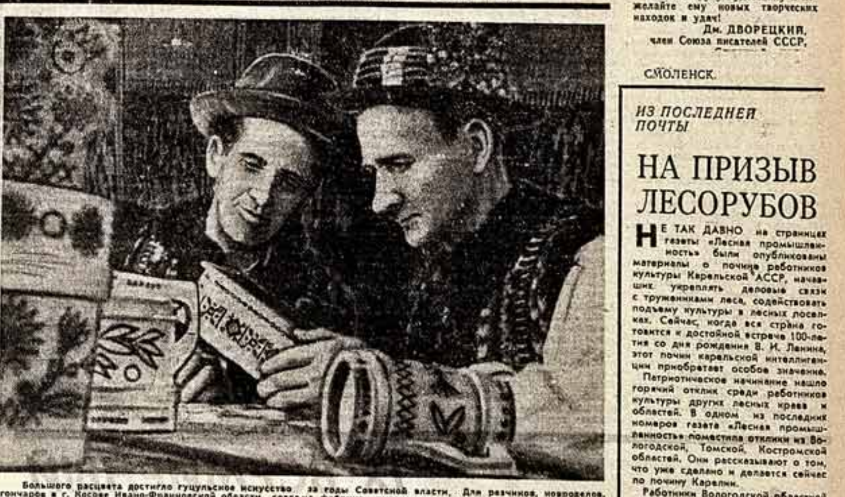
Большой расцвет достигло гонимое искусство за годы Советской власти. Для различных новгородцев, гонимых в г. Новое Ивано-Франковской области создали фабрику художественных изделий «Гудушчинна». Гудушчинна мастера — постоянные участники художественных выставок. Восемь народных умельцев стали членами Союза художников СССР. (справа) за работой.

«БЕЗ РУЛЯ» («СК» 29 июня 1968 г.) Эта статья Сергея Рапопова нас глубоко взволновала. Для нас патристичные архитекторы означают вели историю народа. В общей сумме все памятник архитектуры — это материализованная история нашего Отечества и люди, низкитические отношения с ним, разрушающие их под благовидным предлогом «реконтрукции», чаще всего бездушной, наносят ущерб этой истории.