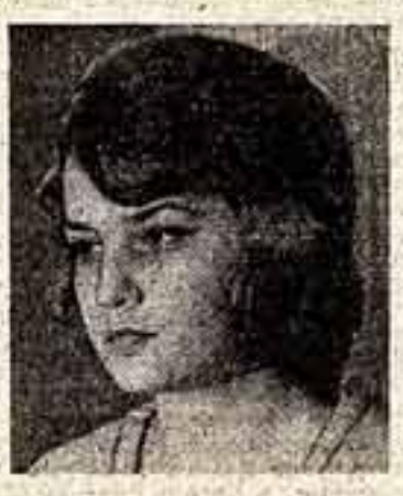
Позади, выпускные экзамены. У студентов всех учебных заведений. Сыграли свои дипломные спектакли и выпускники Театральной школы-студии им. В. И. Маяковского. Дипломно при МХАТе.

ФРИТАУН (Соб. инф.). На днях во Фритауне состоялось подписание протокола о культурном сотрудничестве между СССР и Сьерра-Леоне на 1968—1969 годы. Соглашение предусматривает дальнейшее расширение контактов между двумя странами в области высшего образования, просвещения, культуры, искусства и здравоохранения. В Сьерра-Леоне будут, в частности, проведены показы со-