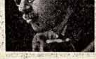
Духовой оркестр «Тригитас» — один из коллективов советского фестивального отряда. Завтра в многотысячной колонне делегатов IX Всемирного он пройдет маршем по красочным улицам Софии и центральному стадиону города, где состоится торжественное открытие фестиваля.