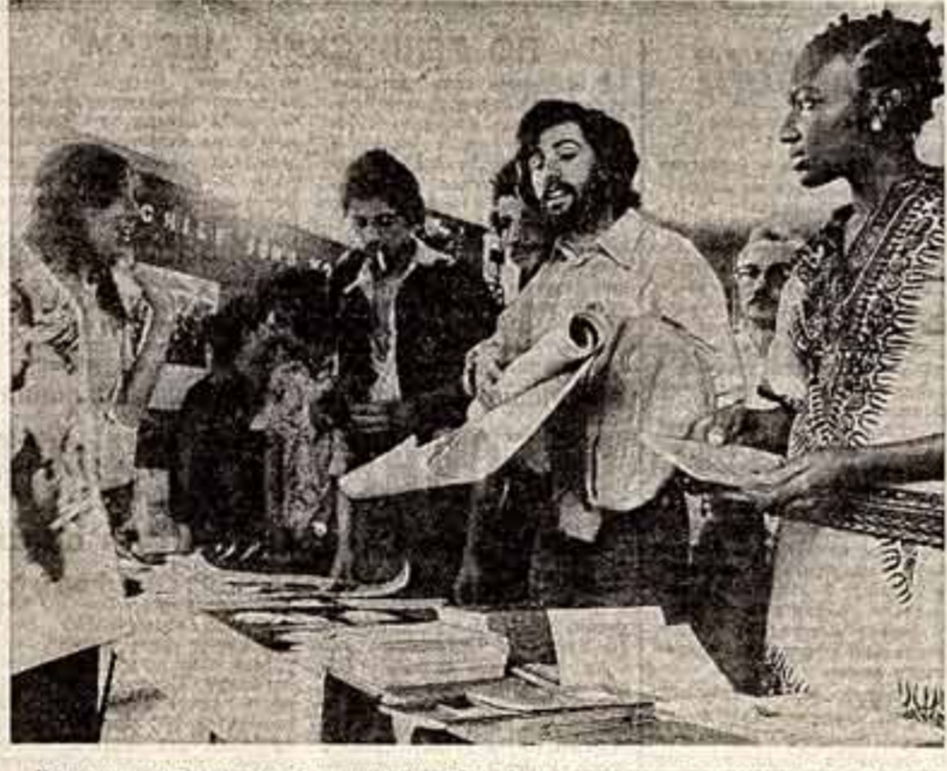
Братскую солидарность с борющимися народами Чили провозглашают прогрессивные люди всего мира.