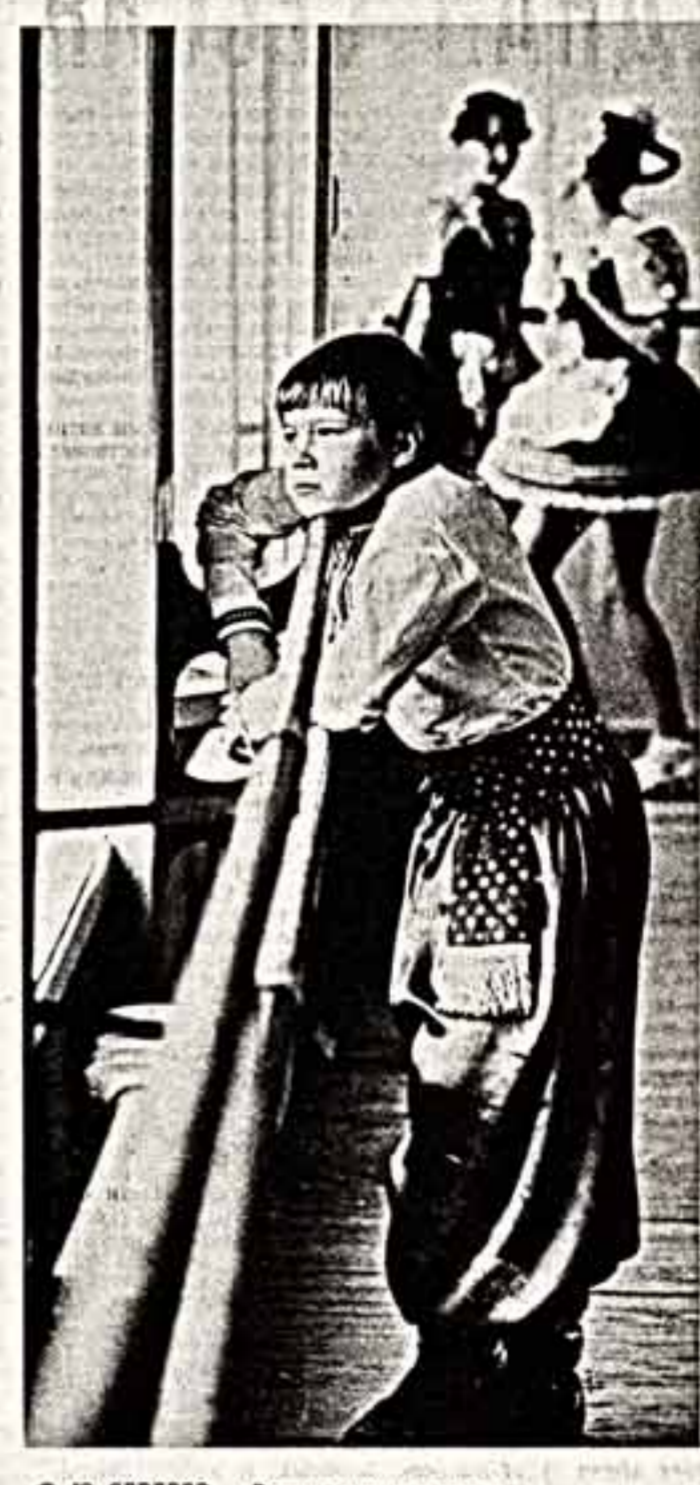
Ю. СЕРГЕЕВ. «Воспоминания о детстве».