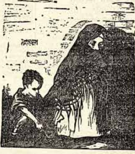
«Голод и холод» — графика Ренни Кап, лауреата Национальной премии сторонников мира Бразилии.

Первая поездка бразильских художников в Советский Союз, — сказала далее К. Скляр, — оказалась весьма плодотворной и полезной. Знакомство с советскими художниками, с сокровищами искусства СССР многому научило нас. Мы чувствуем необходимость кооперироваться в нашей работе, перенять опыт советского искусства, познакомиться и нашим коллегам в Бразилии энергичнее бороться с лагунами формалистическими течениями, насаждаемыми извне, и лучше служить прогрессивному национальному искусству.