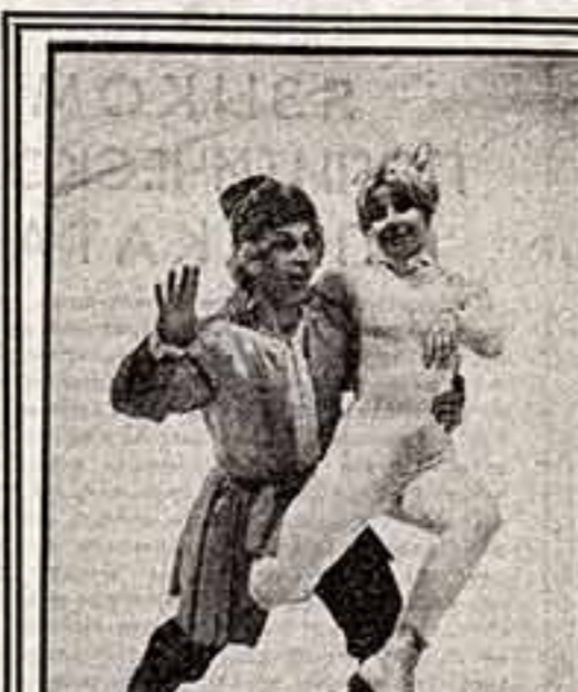
Народный молодежный ансамбль «Валет на льду» Дворца культуры им. Горького на Новосибирске.

Проект кинотеатра разработан в мастерской № 4 Московского научно-исследовательского института типового и экспериментального проектирования.