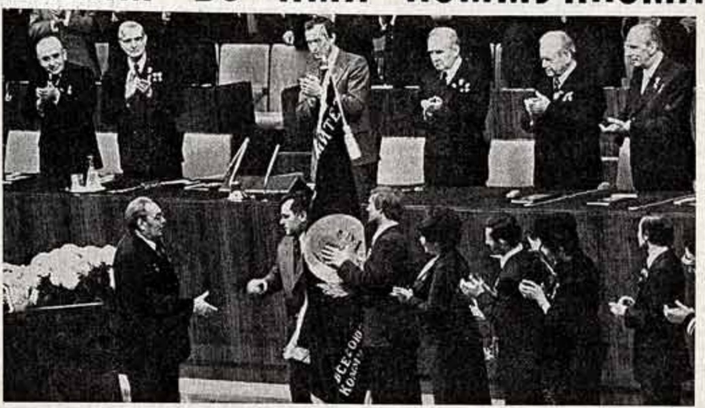
Генеральный секретарь ЦК КПСС товарищ Л. И. БРЕЖНЕВ вручает представителям ВЛКСМ памятное Красное Знамя Центрального Комитета Коммунистической партии Советского Союза.