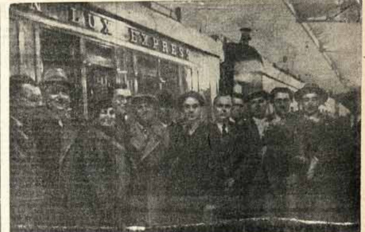
15 июня вечером с белорусского вояжа выехала в Париж делегация советских писателей и драматургов...