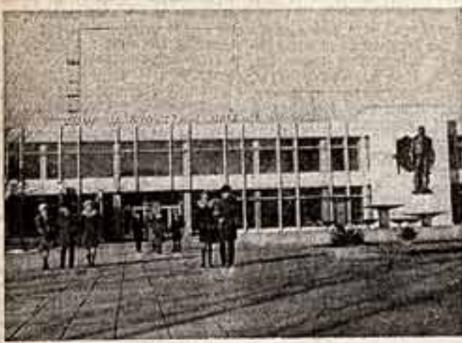
Отличный подарок получили недавно рабочие и служащие Ульяновского приборостроительного завода — вступил в строй Дворец культуры имени В. Клыкова.