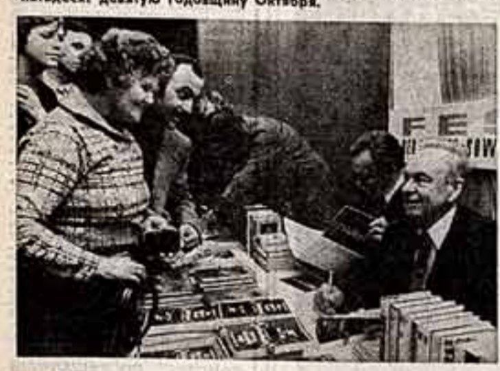
Эти снимки запечатлели только два момента из сотен встреч с советскими людьми...