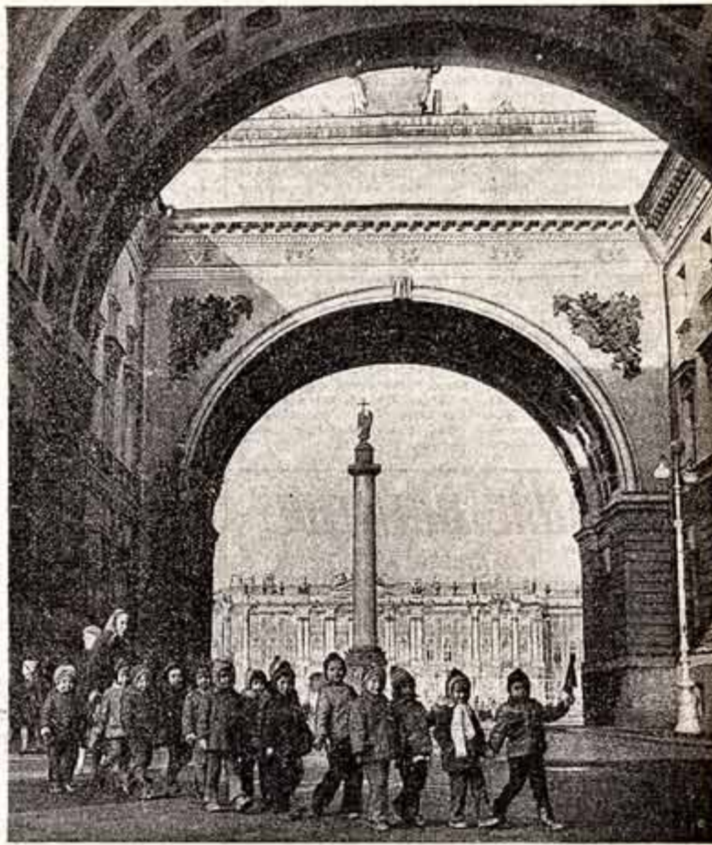
На Дворцовой площади в наши дни.