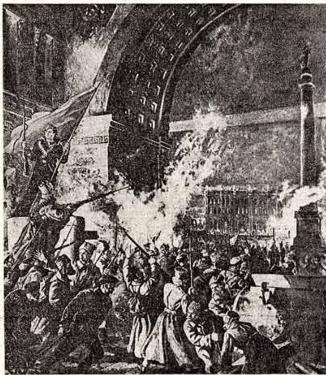
П. Соколов-Скаля. «ШТУРМ ЗИМНЕГО». (Фрагмент картины).

(Из Призывов ЦК КПСС к 59-й годовщине Великой Октябрьской социалистической революции).