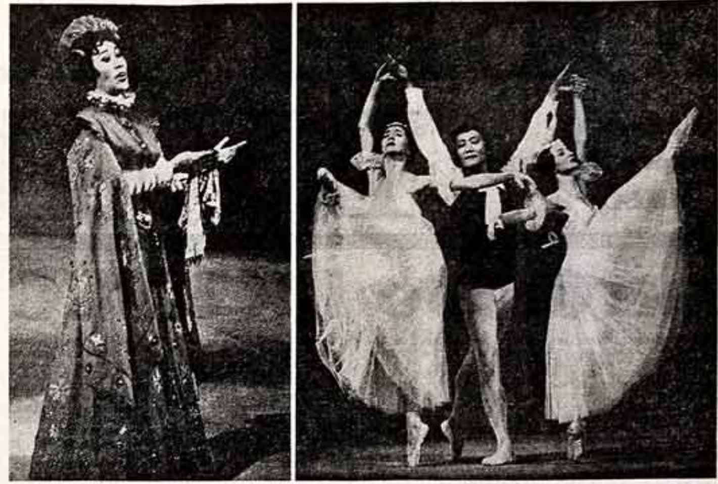
В Москве, на сцене Большого театра Союза ССР, в уличной пародии выступила Киргизская академическая театральная труппа и балета имени А. Мавдыбека.