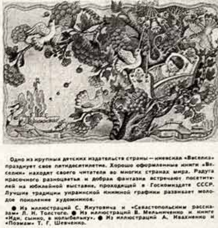
Одно из крупнейших детских издательств страны — ижевская «Веселка» празднует свое пятидесятилетие. Хорошо оформленные книги «Веселки» находят своего читателя во многих странах мира...