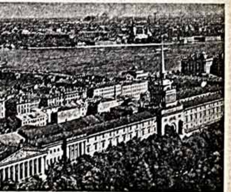
Ленинград сегодня — Спасский, у Дворцовой площади, памятники А. С. Пушкину на площади Искусств, вид на Исаев со стороны Новодевичьего собора.