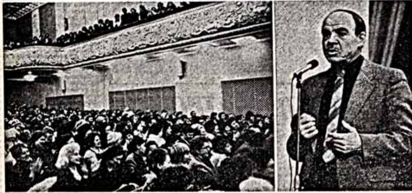
Зал Дома культуры Метростроя. Выступают народный артист СССР А. Баталов, народная артистка РСФСР Л. Соколова, народный артист СССР М. Глузский.