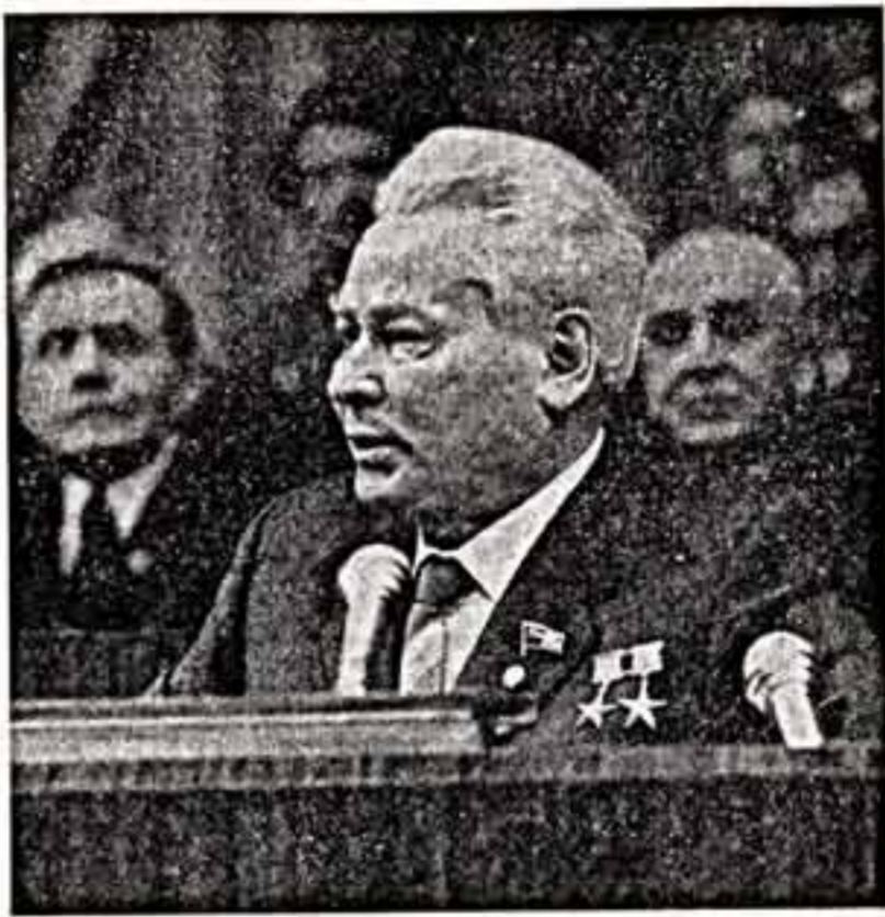
Москва, 3 марта 1984 года. Кремлевский Дворец съездов. Встреча избирателей Куйбышевского избирательного округа столицы с кандидатом и депутатом Верховного Совета СССР товарищем К. У. Черненко.

Коммунистическая партия Советского Союза — руководящая и направляющая сила нашего общества. Высшая цель ее деятельности — служение интересам трудового народа, работа о благо и счастье советских людей. Нерушимое единство ленинской партии и народа, жемчужина социалистического общества вновь убедительно демонстриру-