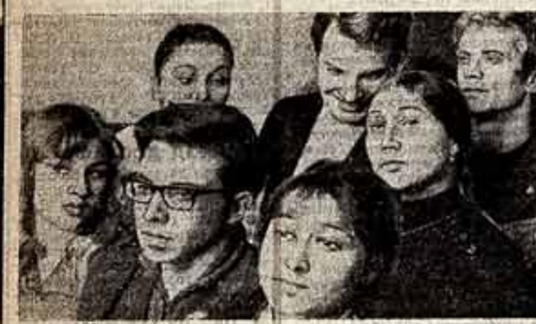
ФАКТ С КОММЕНТАРИЕМ ПО ДАЛЬНЕМУ ВОСТОКУ...