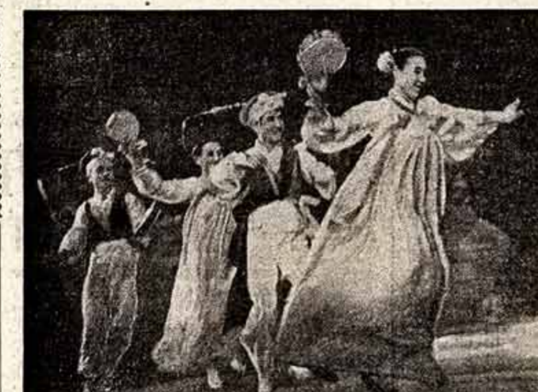
Корейский танец в исполнении хореографического ансамбля.