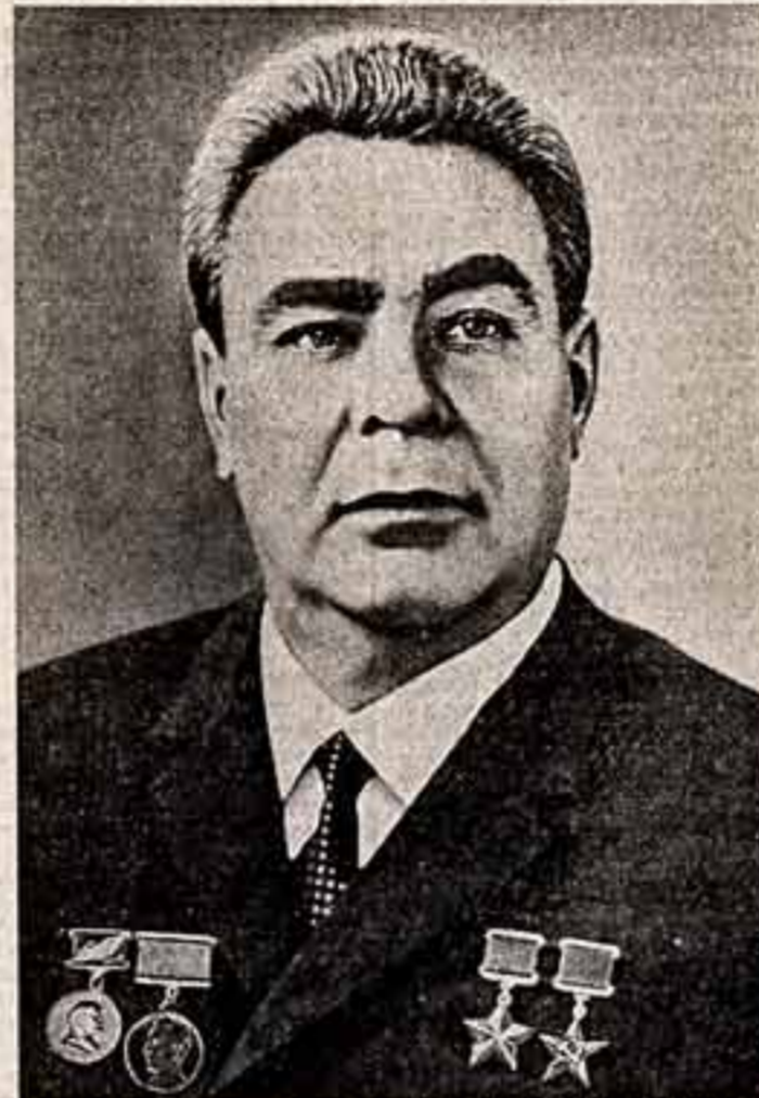
Товарищ Л. И. Брежнев