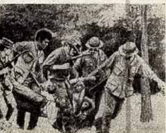
Эта фотография, которую мы перепечатаем из прогрессивной американской газеты «Нью-Йорк таймс», фиксирует один из моментов протеста бывших «дип-ай». В одном из городов штата Нью-Йорк они поставили своеобразный спанклинг, воспринятый «попутчиками» американских солдат во Вьетнаме.

МИСТЕР президент, у Белого дома бушует демонстрация протеста, — в панике сообщает президенту США «первая леди».