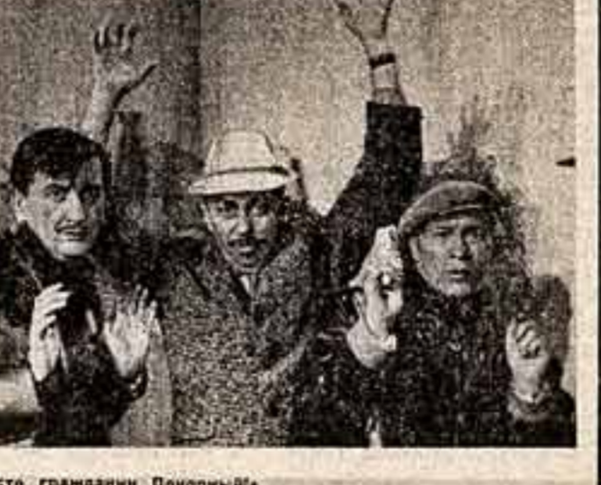
Кадр из нового югославского фильма «На Место, грядущий Понорный».