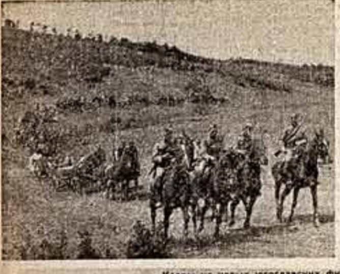
Кадр из нового югославского фильма «Марш на Дринку».

Словом, фестиваль продемонстрировал заметные успехи искусства голубого экрана.