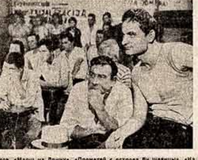
Кадр из нового югославского фильма «Прометей с острова Вх Шейцы».