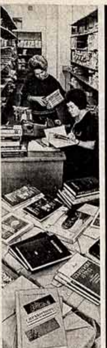
На тридцать тысяч книг пополнились в прошлом году фонды клубов кинолюбителей АССР. Работники республиканского колхозника в Смирновском отделе культуры и искусства, общественно-политическую и художественную литературу.

Работники библиотечно-коллекторского отдела культуры и искусства, общественно-политическую и художественную литературу.