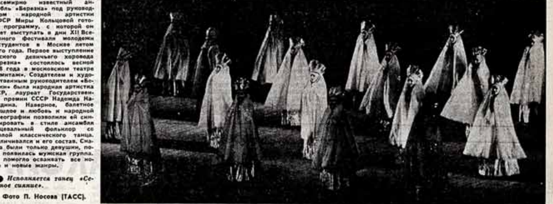
● Непокается танец «Серверное сылье».

надностью смотрят такие сцены. Но во благо ли им такие эпизоды! Включая в спектакль такие волнющие сцены, режиссеры, наверное, хотят подсластить пилюлю — чтобы не так скучно было смотреть. Но не упускают ли они тем самым классику? Ведь в результате подросток получает о нем облегченное представление и, когда берет в руки книгу, ему уже неинтересно. Грустно, что многие молодые люди не читали «Анну Каренину», а о существовании Гончарова и Лескова толкуют ссылаясь, «Войну и мир», «Вашне воды» знают лишь по фильмам. И всему предпочитают детективы — хорошие, плохие ли, все равно, лишь бы сыграть бездумно у телевизора и смотреть все подряд. Для этого не нужно напряжения ума, работы души. И мне кажется, создатели облегченно-современных версий классических произведений потапают молодых в этом. О. РОДИНА-ЛАВРОВА, ЛЕНИНГРАД, Новгород.