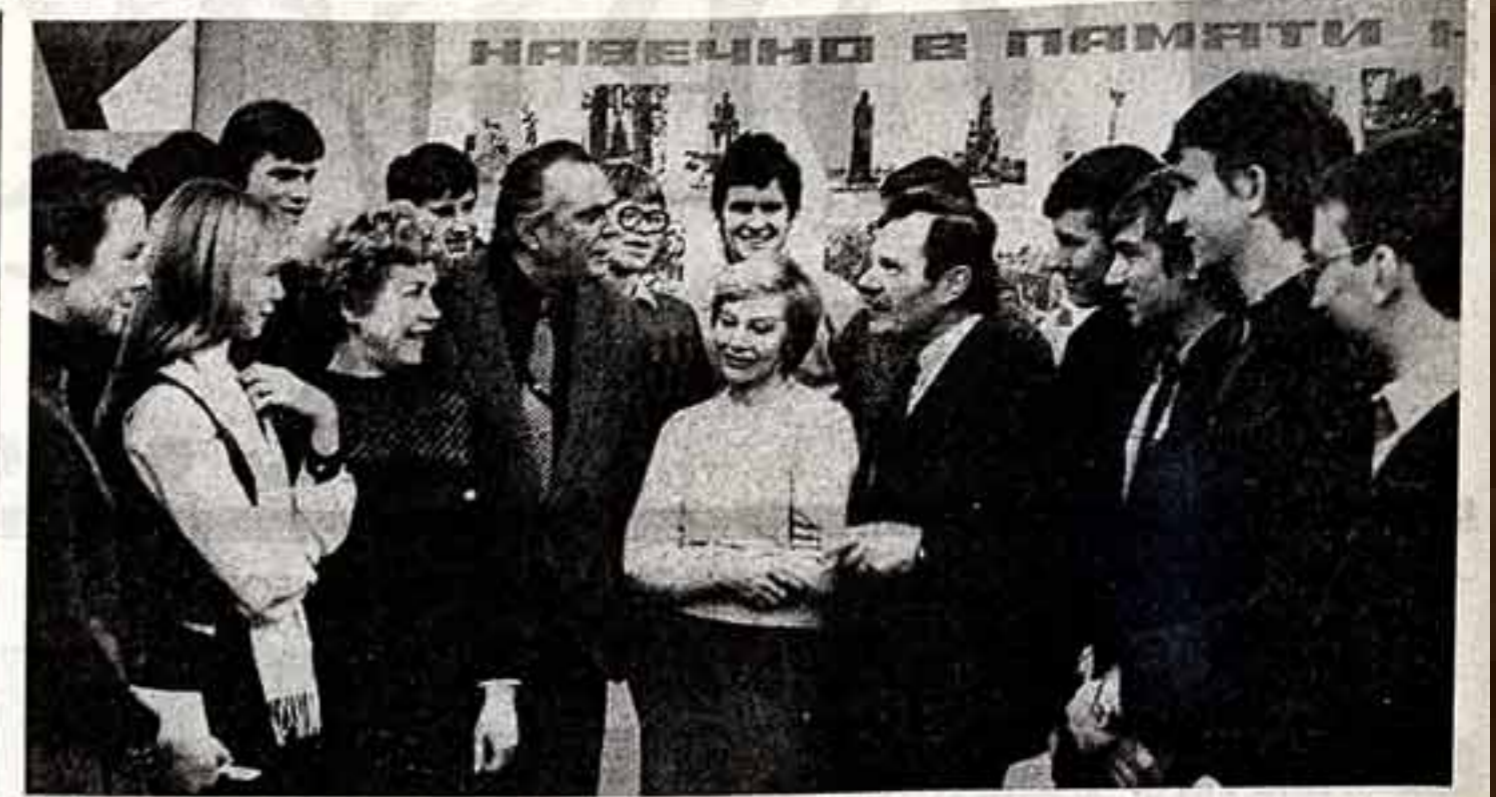
У Московской секции киноактеров Союза кинематографистов СССР есть добрая традиция проведения встреч с коллективами предприятий и учреждений, со студентами студий.