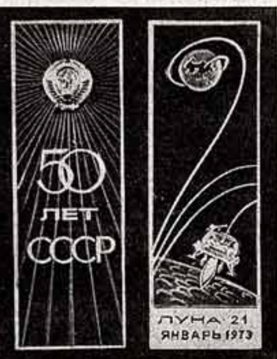
На луноходе с посадочной ступенью установлены Государственный флаг СССР, вымпелы с барельефом В. И. Ленина, изображением Государственного герба Советского Союза и надписью «50 лет СССР». Они изображены на этих снимках.