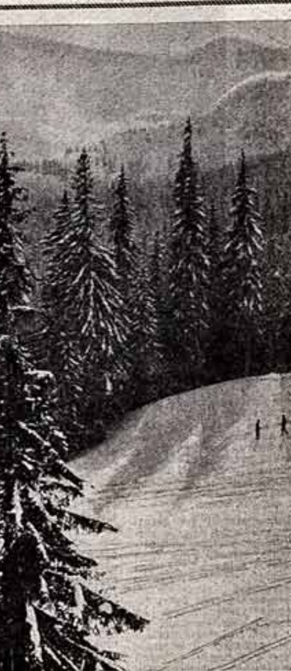
Мы никогда не устанем восхищаться вечной красотой природы, ее живописными пейзажами, изобилием. Но человек создан не только для того, чтобы созерцать мир. Три с половиной века назад английский философ Фрэнсис Бэкон справедливо утверждал: «Не сгибайтесь на природу, она сделала свое дело; очередь теперь за человеком. Люди, раскрывая секреты природы, преобразуют планету. Когда-то они превратили себя в беззащитных, беспомощных перед неужеличными законами природы. Сегодня они всемогущи. Сегодня природа просит у человека защиты».

Возможно, это лишь первый шаг к созданию новой межведомственного органа, который будет наделен не только консультативными, но и административными функциями, который будет иметь в своем распоряжении и материальные средства, и производственные возможности, позволяющие в централизованном порядке решать проблемы, недоступные отдельным министерствам и ведомствам.