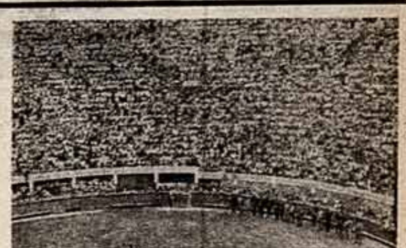
30 тысяч зрителей с интересом следят за выступлением популярного испанского народного песен.

Все это так. Но факт остается фактом. Фестиваль существует, и безуспешно. Особенно популярен он у кинематографистов латиноамериканских стран. Постояльцы его участники также — Советский Союз, Италия, Франция, Соединенные Штаты.