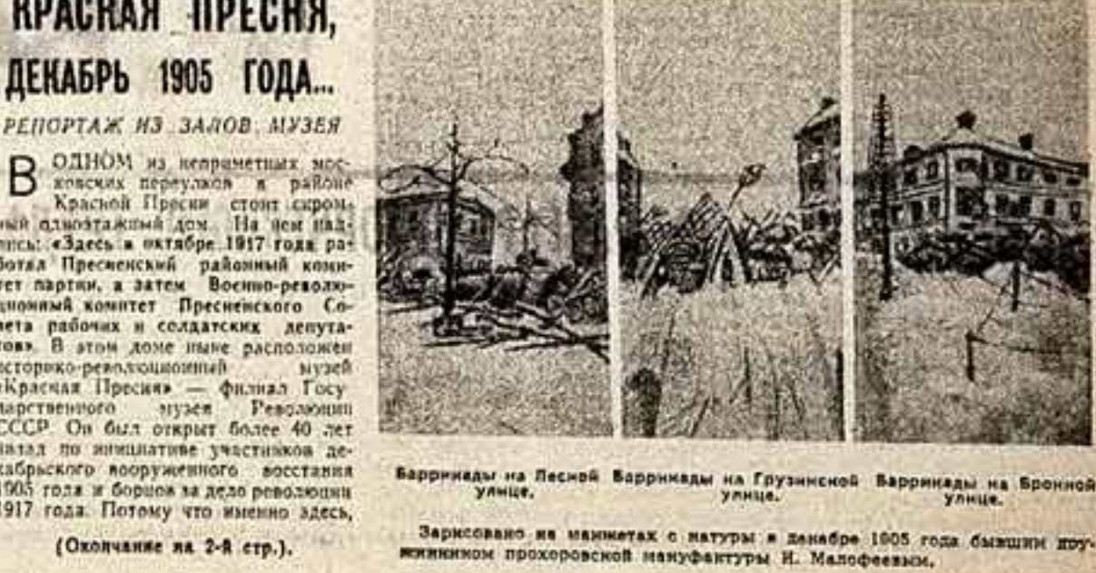
Баррикады на Лесной Баррикады на Грузинской Баррикады на Бронной улице.