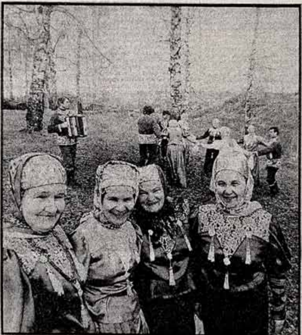
Фольклорный ансамбль «Галычючка» — один из коллективов Галычского районного фольклорного ансамбля. В его репертуаре широкое, образное и свободные песни. Любит «Галычючку» не только в Костромской области, но и за ее пределами.