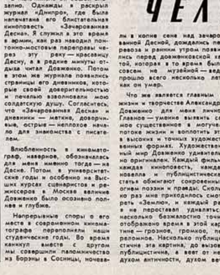
В мою жизнь он вошел внезапно. Однажды в раскряпанной «Дниро»...