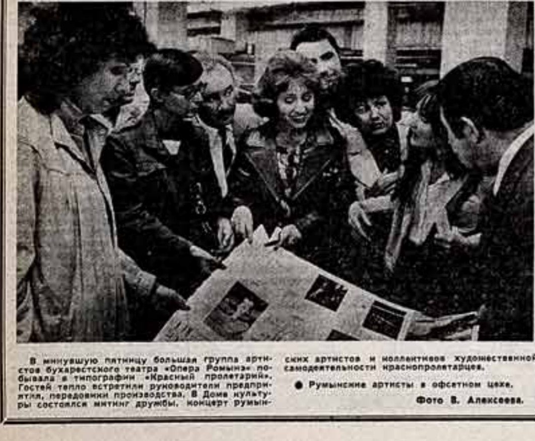
В минувшую пятницу большая группа артистов Бухарестского театра «Опера Романы» побывала в гастроли в «Красный пролетарий»...