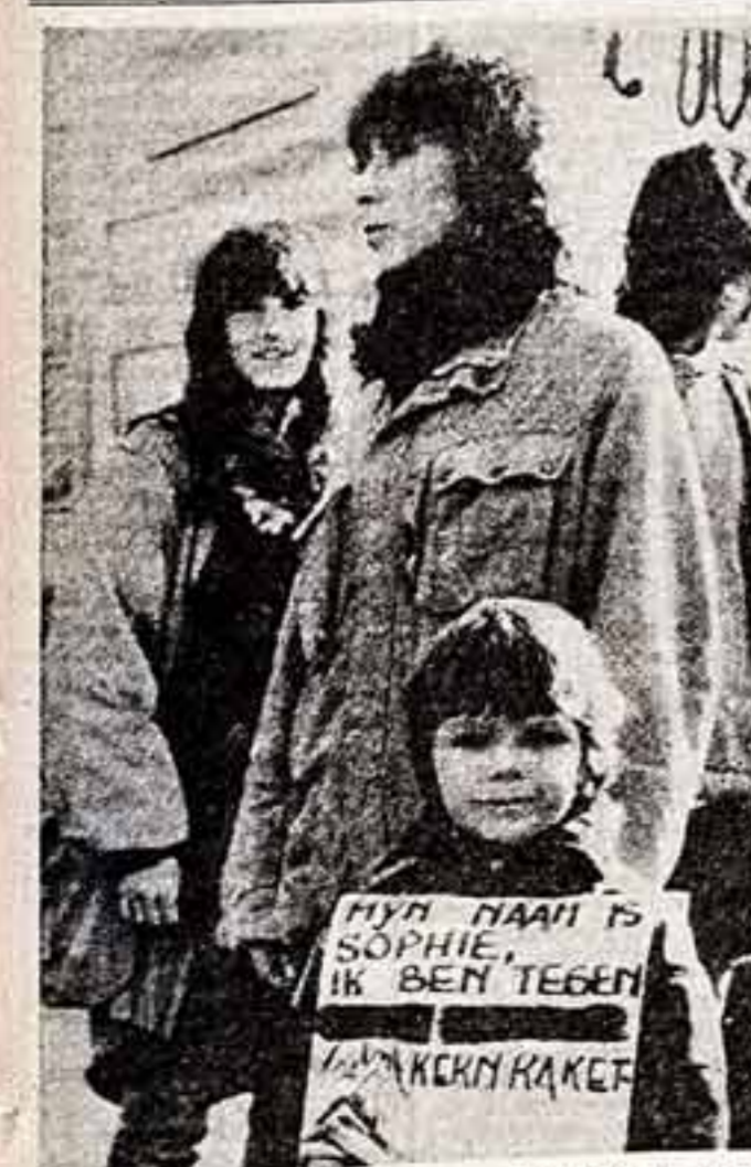
«Меня зовут София. Я против ядерных ракет» — написанно на плакате юной участницы манифестации в Антверпене...