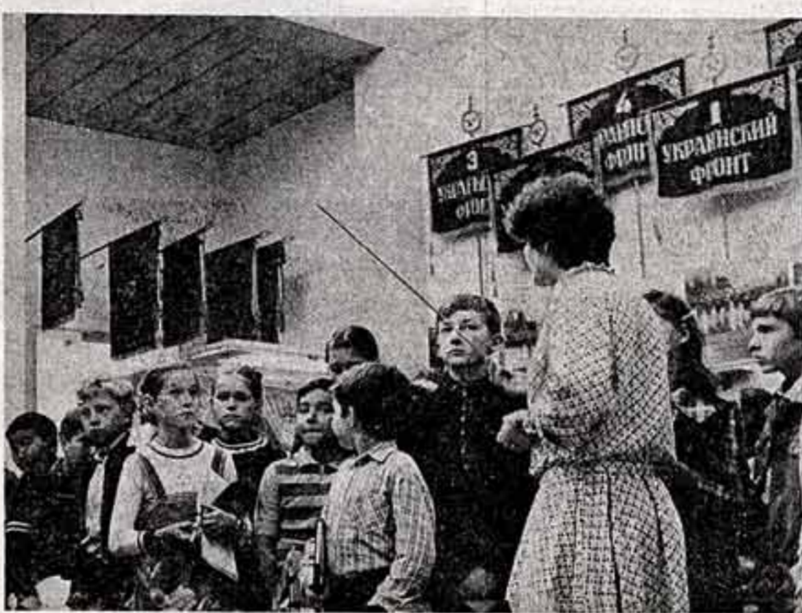
Многочисленно в эти дни в Центральном музее Советской Армии. В его залах проходят встречи с ветеранами Великой Отечественной войны, многочисленные экскурсии идут одна за другой. В первые дни нового учебного года пришли сюда в учащихся Московской средней художественной школы при Институте имени В. И. Сурикова.