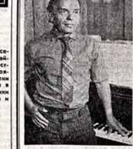
ШАНСКИЙ В. А., заслуженный деятель искусств РСФСР.