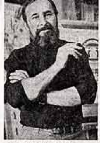
ТАЛБЕРГ Б. А., заслуженный художник РСФСР.