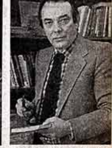
СЕЙФУЛОВ М., народный артист СССР.