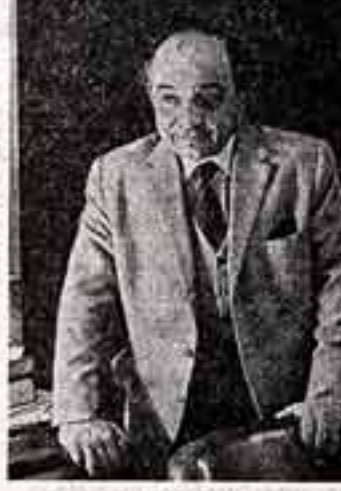
КАПЛАН Г. Н., народный артист СССР.