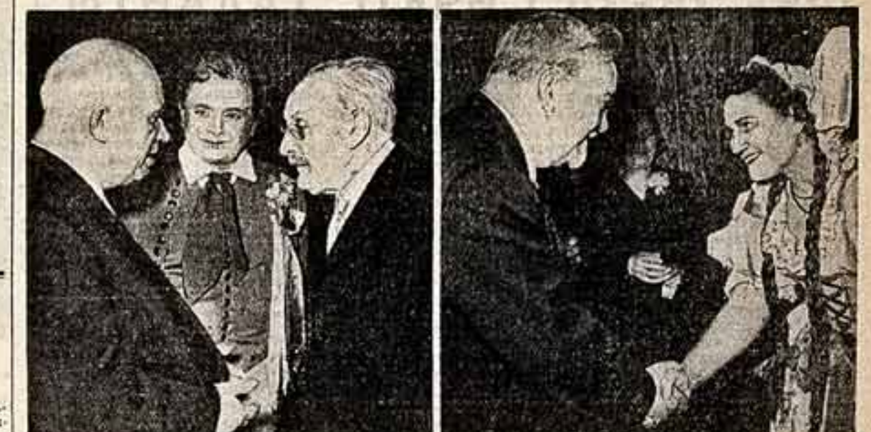
В Национальном театре в Праге в честь гостей из Чехословакии советской Партийно-Правительственной делегации состоялся торжественный прием. Вышла почтовая марка иллюстрирована Б. Сметаны «Продажная невеста». На снимках: 1. Во время антракта М. С. Хрущев беседует с Президентом Чехословацкой Академии наук министром Дзенином Неудом и заслуженным артистом Ольдриком Новарнем, исполнителем роли Енны. 2. М. А. Булгакин приветствует артиста Драгомира Ткачука, исполнителя роли Енны.