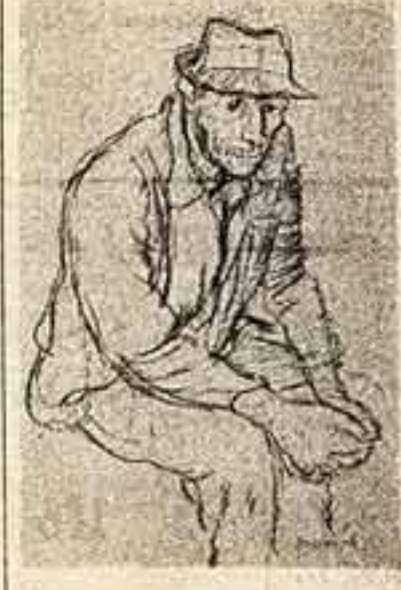
Поль Хогарт. «Каменищи».

В Москве состоялась выставка английского искусства «Глядя на людей». Выставка организована под эгидой Русского музея, в подражание которому выполнены многие из этих работ. В них чувствуется явная искренность, потерянная на непосредственной оценке, которая составляет главную прелесть подлинного детского творчества. Поль Хогарт, третий графин, прозвучавший из его имени на выставке, уже известен в Советском Союзе. Творчество этого