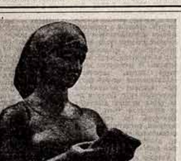
В. Стамов. «Земляки Клева».

Богато и ярко выглядят на выставках наше многообразное по видам и стилям прикладное искусство. Но, что скрывает, до сих пор существует разрыв между выставочными экспонатами и теми вещами, которые идут к потребителю. А как бы ни рвалось нас участие в выставках, мы лишь тогда удовлетворим своим трудом, когда наши изделия входят непосредственно в жизнь человека.