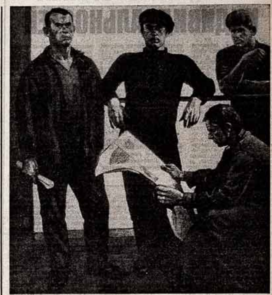
Ф. Иезишвили. «Ташумашевцы».