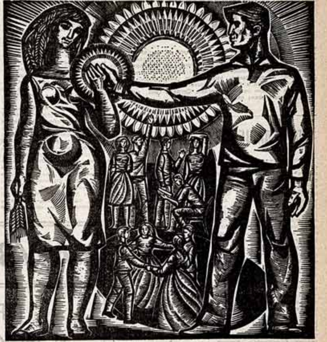
Г. Кроллес. «Зрелость».