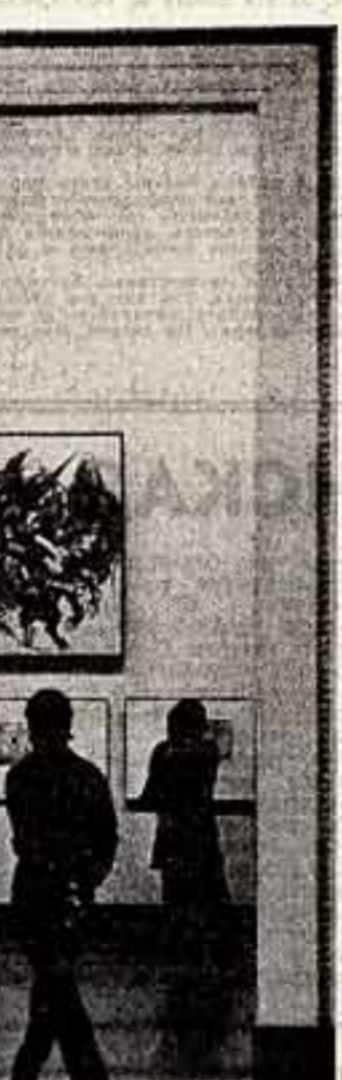
У мексиканской и гостей стояли экспозиция вызвала огромный интерес. На снимке: в залах выставки, у картины Д. Сикейроса.

мексиканских городов, или мрачным Филипп II с католическим крестом и короной, несомненно хочется сказать: Ороско — это Эль Греко двадцатого века.