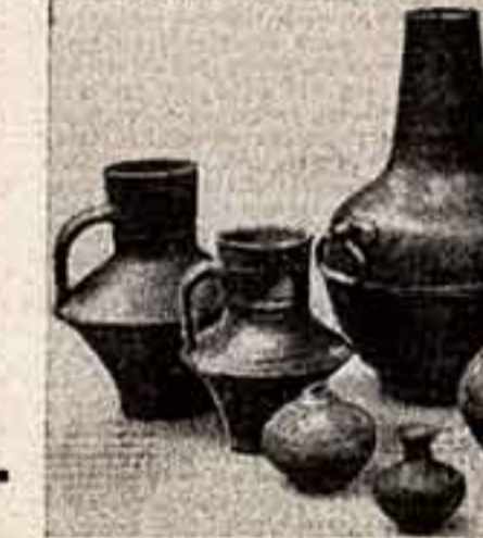
Древние сосуды, найденные в недрах площади Ногина.

Древние сосуды, найденные в недрах площади Ногина.