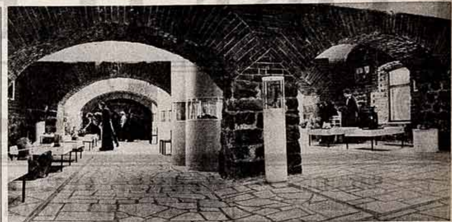
СВЕРДЛОВСК. Студенты факультета архитектуры промышленных зданий и архитектурного искусства архитектурно-художественного института создали музей старой техники. Он расположен в центре города и здания, сохранившиеся от старого Екатеринбурга.

В последние годы культуры республики. Два года подряд мы завоевывали из года в год Красное знамя ЦК Компартии Таджикистана.