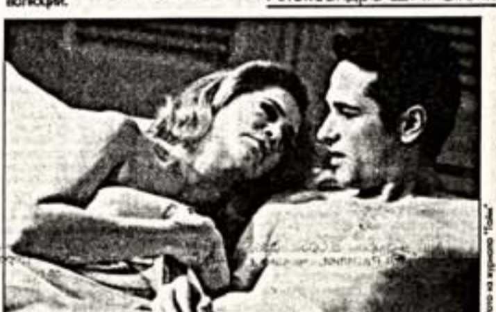
Сцена из спектакля "Выпускник"

По материалам зарубежной печати подготовила Александра ШИРОКОВА