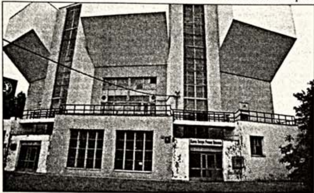
Клуб им. Русакова

Ни в одном из зданий К.Мельникова еще не было капитального ремонта