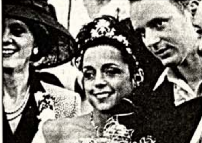
Кадр из фильма "Славные люди"

Продажа билетов в кассах кинотеатра и в Центральном доме кинематографистов по адресу: ул.Васильевская, д.13. Дополнительная информация по тел.: 251-12-01.